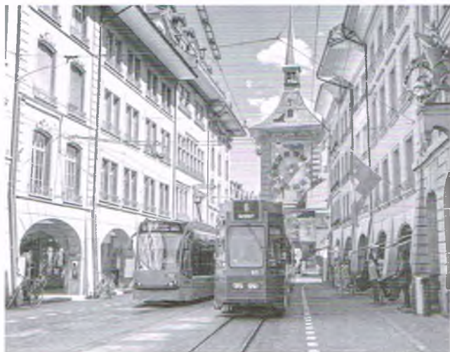
Berno w pigułce. Kunsztowna stolica Szwajcarii

Berno – szwajcarska stolica (a raczej miasto pełniące tę rolę, gdyż Szwajcaria stolicy nie posiada), siedziba rządu. Kunsztowne miasto, czwarte co do wielkości i ludności miasto Szwajcarii. Może poszczycić się wyjątkowo piękną średniowieczną starówką