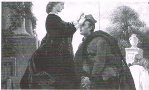
Pożegnanie powstańca – obraz Artura Grottgera z 1866 roku

Jednakże ten zryw narodowy już od początku miał niska szanse powodzenia. Wybuchł w najbardziej nieprzychylnych warunkach wśród wszystkich poprzednich powstań. Nie istniała jeszcze wtedy regularna armia polska, tylko zni-