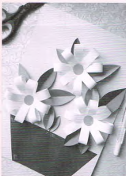
Jak zrobić kwiaty z papieru (zrobione ręcznie)

Kochana Babciu – zacznę zwyczajnie, że z Tobą w domu jest fajnie: i w deszczu i w słońcu, w smutku, w radości, wspierasz i uczysz życia w miłości. Dzisiaj za wszystko chcę Ci dziękować i skromny bukietik kwiatów darować. Babciu najmiłsza i najdroższa, Twoja miłość jest najśodsza, szczerą i bezwarunkową, prawdziwą, bezproblemową. Dlatego chcę podziękować i moje życzenia ofiarować, z serca prosto płynące: prawdziwe i gorące!