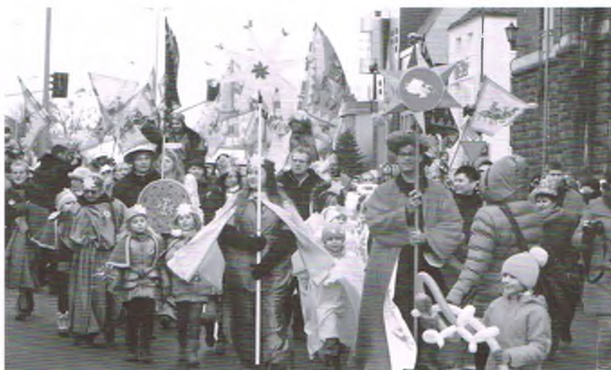
Orszak Trzech Króli w Olsztynie

Orszak jest jednocześnie teatrem ulicznym, formą zabawy, a także dążeniem do bycia we wspólnocie. Święto Trzech Króli to czas, kiedy możemy dziękować za obecność Boga w historii człowieka. W dniu 6 stycznia