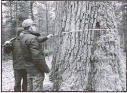
Nadleśnictwo Daleszyce Lasy Państwowe. Dąb Józef

poległ w czasie Powstania Listopadowego podczas obrony Warszawy przed Rosjanami w 1831 roku.