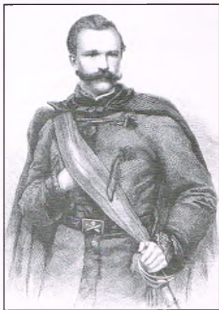
Generał Marian Langiewicz