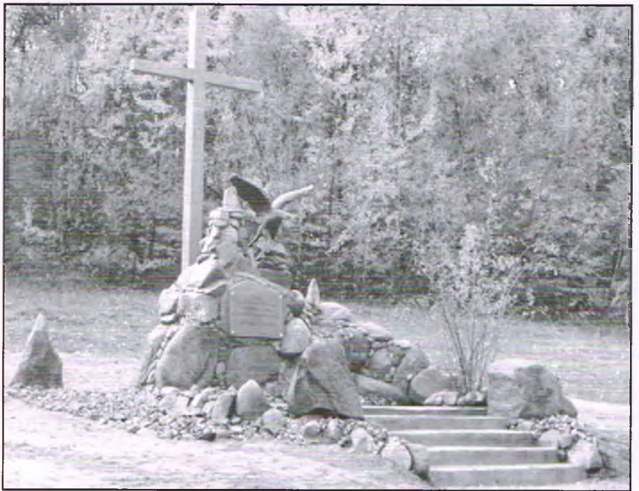
Pomnik upamiętniający bitwę pod Rybnicą na terenie Nadleśnictwa Staszów. Pomnik z głazów. Na szczycie pomnika znajduje się orzeł, obok stoi krzyż

Lasy w Polsce kryją w sobie wiele akcentów z tamtych czasów. Są tam krzyże, płyty z napisami, pomniki stawiane przez pamiętających, tablice umieszczone na drzewach, a także po prostu stare potężne drzewa o zadziwiająco grubych pniach, które są