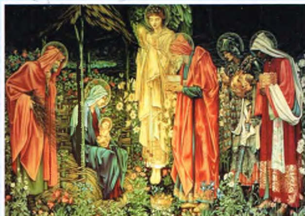
Pokłon Trzech Króli

Po krótkim okresie spokojnego marszu ujrzał wiszący na drągu strzęp czarnej chorągwi. Był to znak, że tu panuje „czarna śmierć” czyli cholera. Pomyślał, że nie może przejść obojętnie wobec takiego nieszczęścia, takiej nędzy ludzkiej, przecież jedzie do Króla Miłości. Nie miał już w zasadzie niczego. Zostały mu tylko wierzchowce i wierni słudzy. Zszedł więc ze swojego wielbłąda i widząc przerażenie w oczach swych towarzyszy, powiedział, że jeżeli ktoś chce, to niech odejdzie. A on tu zostanie, aby pomóc ludziom, którzy jeszcze żyją. I zaczął pomagać potrzebującym, troszcząc się o nich, przynosząc im wodę i pożywienie. Zostało przy nim tylko kilku towarzyszy.