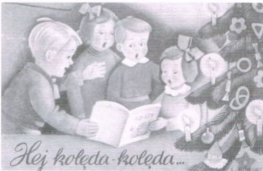
Hej kolęda, kolęda!

Kolędnicy, 1949, Czesław Miłosz (1911-2004)