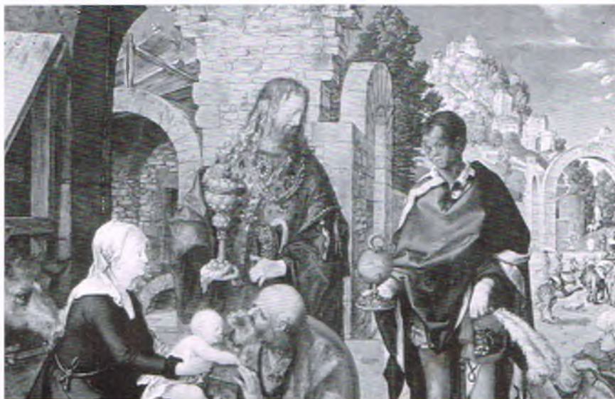
Pokłon Trzech Króli, mal. Albrecht Dürer

odwiedzały w tym dniu grupy kolędników z turoniem, kobyłką, niedźwiedziem, także chłopcy przebrani za Trzech Króli, w złotych, tekturowych koronach i – niekiedy – w szatach liturgicznych, starych i podniszczonych kapach i ornatach, wypożyczonych z zakrystii kościelnej. Tak jak inni