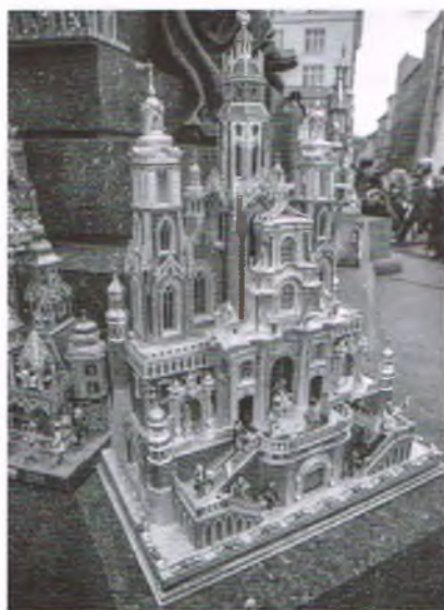
Szopki Bożonarodzeniowe

Najstarsze szopki krakowskie, niektóre o wysokości nawet ponad dwóch metrów, przenośne, bożonarodzeniowe teatrzyki kukielkowe z przełomu XIX i XX wieku zachowały się jedynie w krakowskim Muzeum Etnograficznym. Najstarszą i najcenniejszą jest szopka wraz z kukielkami wykonana w latach 90. XIX wieku przez Michała Ezenekiera (1854 – 1914/1918), mistrza murarskiego z Krowodrzy. To na niej, nazywanej „szopką matką”, wzorowały się całe pokolenia szopkarzy, to ona zainicjowała styl architektoniczny szopek, zwany ezenekierskim.