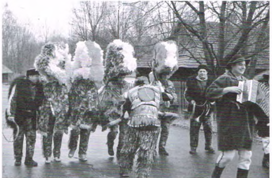
Dziady Noworoczne, grupa ze Zwardonia

Kiedyś wierzono, że gdyby Dziady nie „przeleciały” przez wieś, nie rozpocząłby się Nowy Rok. Widowisko stanowiło dawniej ważny obrzęd kreujący po-