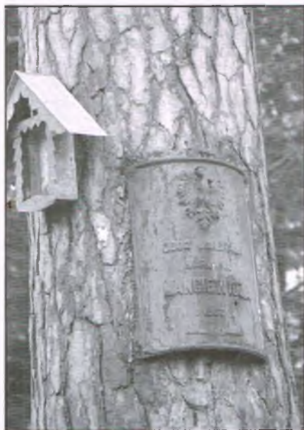
Nadleśnictwo Skarżysko. Tablica pamiątkowa poświęcona gen. Langiewiczowi i jego oddziałowi