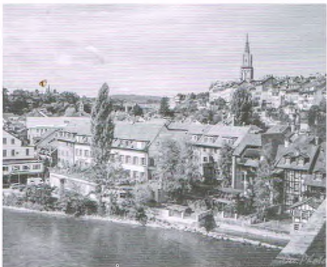
Berno – miasto fontann (Małe miasteczka DEE)