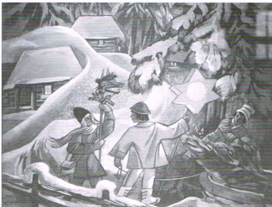
Kolędnicy, Zofia Stryjeńska, Boże Narodzenie

Kolędnikom ofiarowywano słodycze, orzechy, suszone owoce lub drobne datki pieniężne.