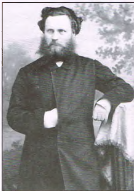
Generał Ludwik Mierosławski*