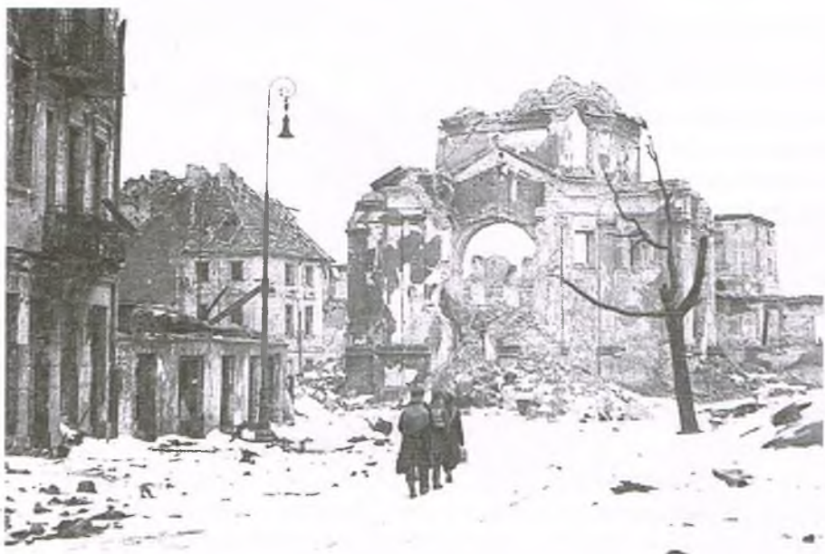
Warszawski styczeń 1945 roku. Rynek Nowego Miasta i ruiny kościoła Sakramentek