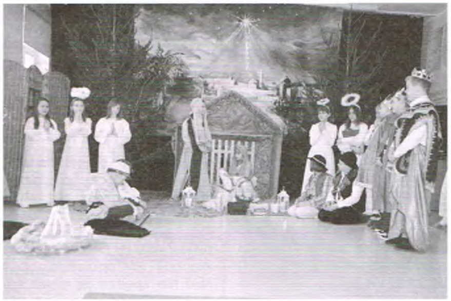
Jasełka wystawiane przez dzieci, to piękna tradycja w polskich szkołach (strona internet. Jasełka w szkole w Sokolicy )

Na początku jasełka były ilustracją popularnych kolęd i pastorałek, z postaciami w nich występującymi: Świętą Rodziną, aniołami, Trzema Królami oraz pastuszkami składającymi hołd Dzieciątku. Z biegiem czasu figurek przybywało, a przedstawienia wzbogacały się o świeckie motywy, nawiązania do współczesnych wydarzeń i zabawne scenki. W ten sposób jasełka z religijnego misterium przekształcały się w miniaturowy ludowy teatr. I właśnie z uwagi na ten świecki charakter w XVIII w. biskupi polscy zakazali wystawiania jasełek w kościołach. Jasełkowa twórczość nie zniknęła jednak, lecz przeniosła się za mury świątyni i zachowała w polskich obchodach kolędniczych. Pozostała swojską opowieścią o narodzeniu Jezusa w Betlejem, o radości ludzi dobrej woli, pokłonie Trzech Króli,