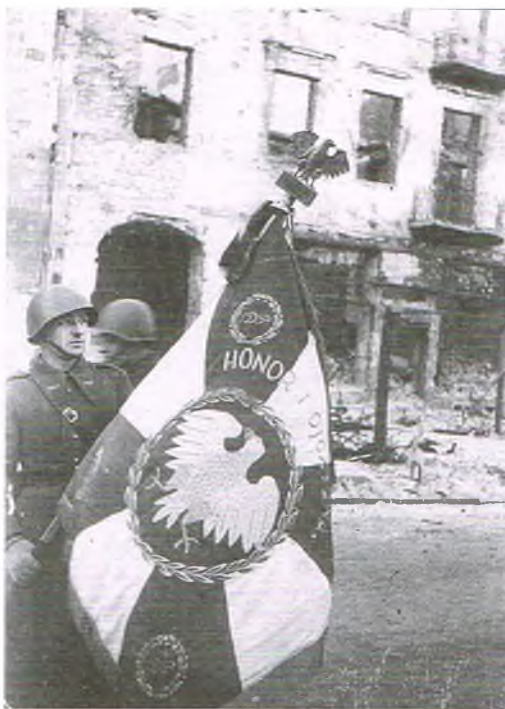
Warszawa, styczeń 1945 roku. Polski żołnierz ze sztandarem 1 Dywizji Piechoty im. Tadeusza Kościuszki

Modlono się o życie najbliższych, gdziekolwiek są. Nie wiadomo bowiem dokąd ich ta nawałnica nieludzkiego okrucieństwa zagnęła. Mieli nadzieję, wierzyli, że oni się odnajdą, że jeszcze nie wszystko stracone, że nadejdzie taka chwila, kiedy wezmą się w ra-