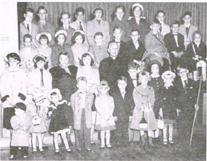
Przy parafiach PNKK w USA i Kanadzie powstawały różne zgromadzenia patriotyczne, Towarzystwa skupiające całe rodziny polskich emigrantów. Na archiwalnym zdjęciu z 1954 roku możemy obejrzeć grupę chłopców i dziewczynek z Towarzystwa Obrońców Kościoła, Trenton, New Jersey