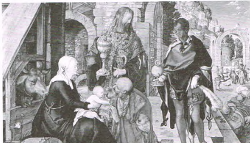
Hołd Trzech Króli, obraz Albrechta Dürera (1471 – 1528)

obchody Bożego Narodzenia. Zygmunt Gloger pisze: „Dzień Trzech Króli, jako dzień darów składanych przez króli Jezusowi, zwano „szczodrym dniem”,