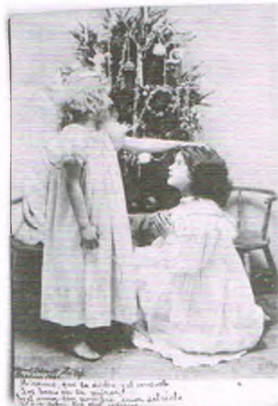
Archiwalna świąteczna karta pocztowa z 1901 roku

Przez 12 pierwszych dni stycznia pilnie obserwowano niebo, by wywróżyc pogodę na kolejne miesiące roku. Najważniejszy w tych obserwacjach był jednak pierwszy dzień – Nowy Rok, w którym wróźono o przyszłych plonach. Wróźby te przetrwały w znanych do dziś przysłowiach: