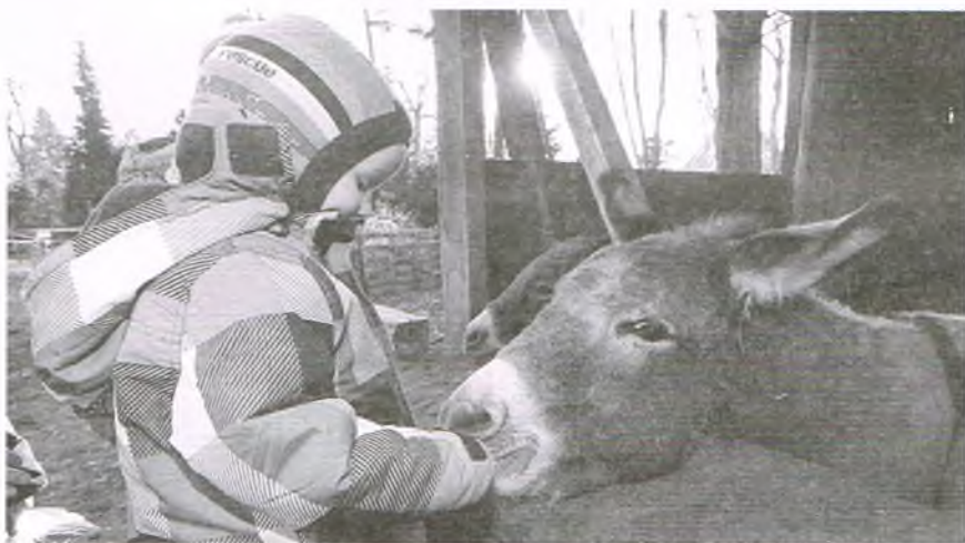
Żywa szopka (Wikipedia)

W ostatnich latach swój renesans przeżywają żywe szopki,