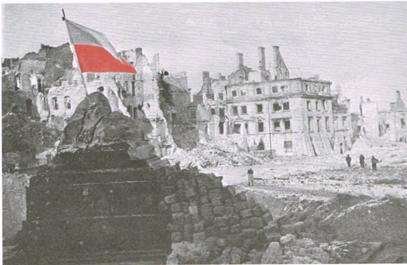
Warszawa, 17 stycznia 1945 roku. Wśród ruin miasta powiewa polska flaga zatknięta w zburzoną kolumnę Zygmunta

W styczniu 1945 roku tak naprawdę przestała istnieć, już jej nie było. Zamieniono ją w jeden wielki stos ruin zwalonych domów, powyrywanego bruku ulic, strzępów walających się łachmanów, powyginanych żelaznych prętów, resztek czegoś, co było kiedyś meblami,