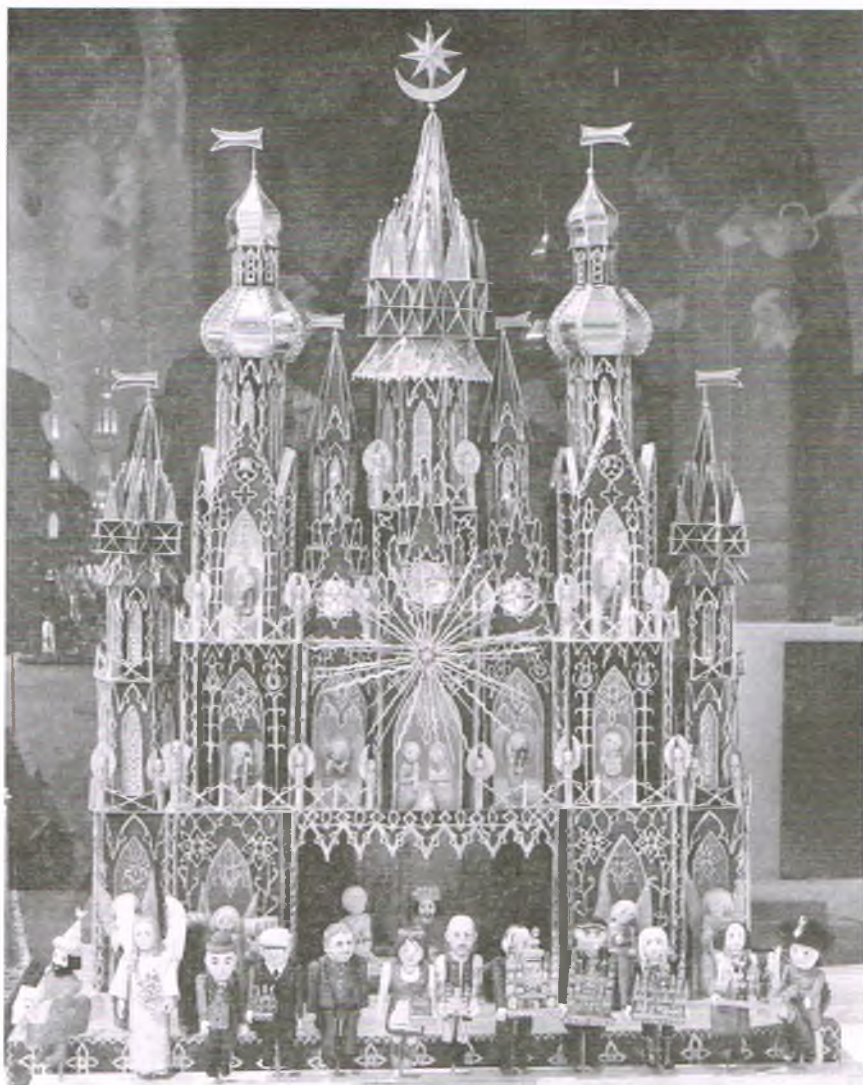
Szopka krakowska (strona internet. 72. Konkurs Szopek Krakowskich: Najpiękniejsze szopki krakowskie w Pałacu Krzysztofor)

Mimo upływu wieków w wielu dzisiejszych kościołach możemy podziwiać szopki, które pominiawszy szczegóły, odpowiadałyby temu opisowi. Są i takie, których twórcy co roku prześcigają samych siebie w pomysłowości. Do nich należą jedyne w swoim rodzaju szopki krakowskie, fenomen na skalę światową. Ich forma to jakby baśniowa wersja gotyckich i barokowych zabytków starego Krakowa – kościoła Mariackiego i wielu innych świątyń, zamku królewskiego