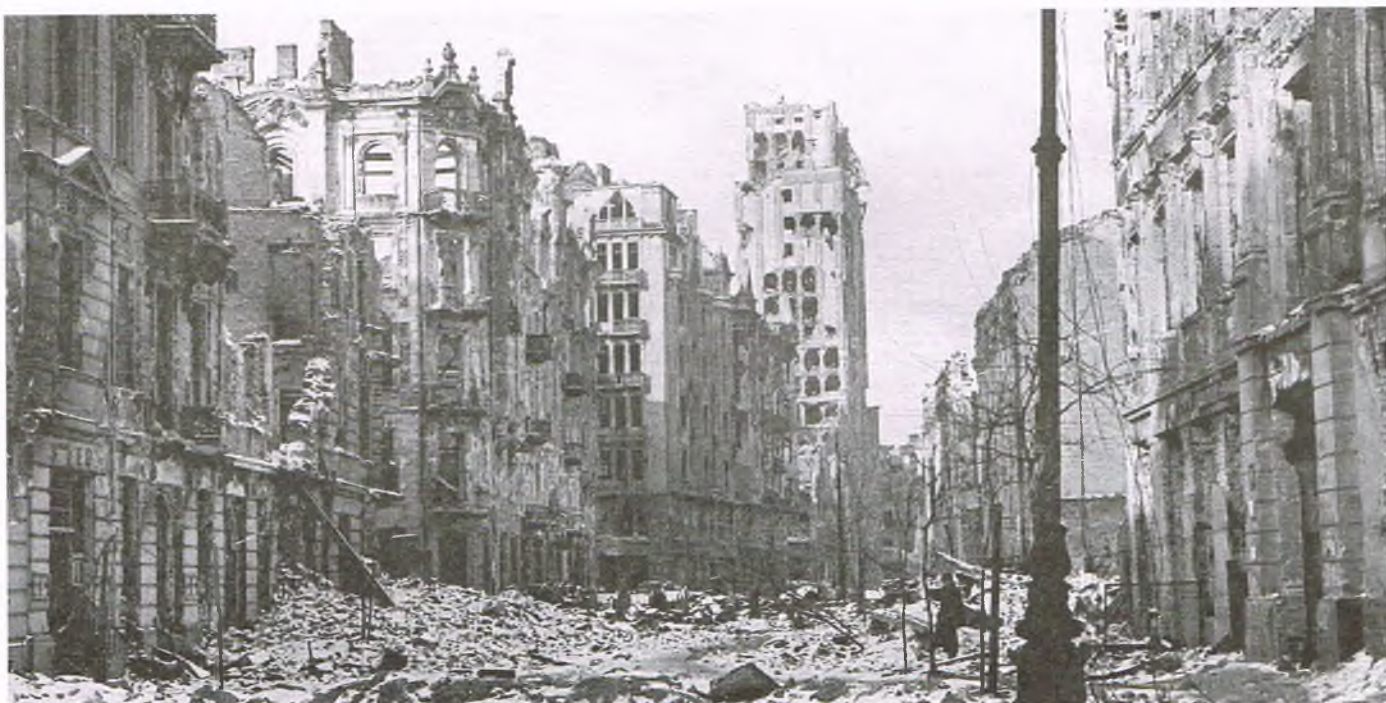
Styczniowy dzień Warszawy roku 1945. Kiedyś był tu „Paryż Północy”