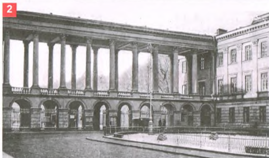
WARSZAWA. Fragment z ogrodu Saskiego. VARSOVIE. Fragment du Jardin de Saxe.