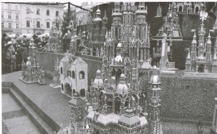
Konkurs szopek krakowskich, Kraków Rynek Główny

łów, Sukiennic, Wawelu. Tradycja budowania szopek rozpowszechniła się w XIX wieku wśród murarzy i robotników budowlanych, poszukujących zarobków w okresie jesienno-zimowym. Te współczesne stanowią świadectwo pasji i talentu swoich twórców, często przedstawicieli wielopokoleniowych rodzin szopkarzy.