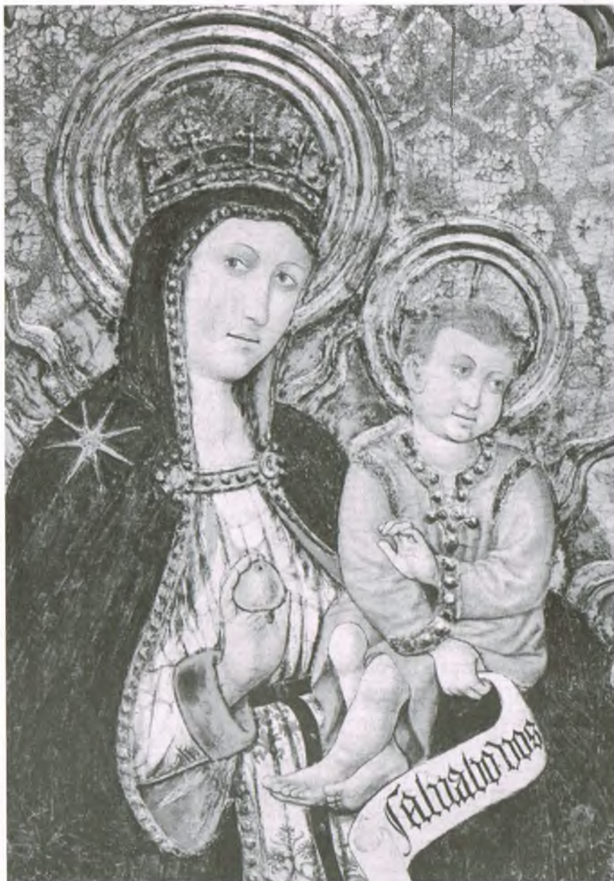
Matka Boża z Dzieciątkiem Jezus (Muzeum Sztuki Katalońskiej w Barcelonie, Hiszpania)

Wciąż świętujemy narodzenie Jezusa Chrystusa, bo – choć jest to święto Maryi – trudno jest oddzielić Matkę od Syna. Wchodząc w Nowy Rok, wzywamy imienia Świętej Bożej Rodzicielki