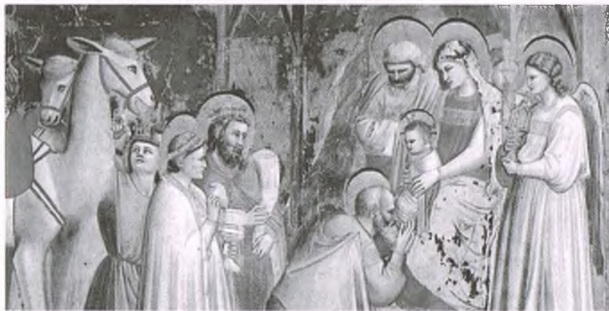
„Pokłon Trzech Króli”, Giotto

re są pierwszymi literami łacińskiego zdania: (Niech) Chrystus mieszkanie błogosławi – po łacinie: Christus mansio-