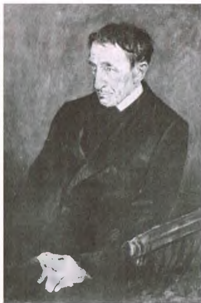
Ignaz Von Döllinger (1799 – 1890)

Jego niezwykła pilność, godna podziwu inteligencja, rozległa wiedza, zadziwiająca znajomość języków, a przy tym wspaniały dar wymowy, wykwintny, celny sposób pisanie oraz niezawodna pamięć – predestynowały go do objęcia naukowego przewodnictwa budzącego się do nowego życia katolicyzmu niemieckiego oraz do zdobycia pozycji pioniera nowej epoki w teologii katolickiej. W katolicyzmie obudziła się nowa samoświadomość i w monachijskim romantycznym kręgu zwolenników i uczniów Józefa Görresa (1776 – 1848) – w którym I. Döllinger aktywnie działał – wobec trudnej sytuacji protestantyzmu, zapanowało przekonanie o rychłym jego końcu.