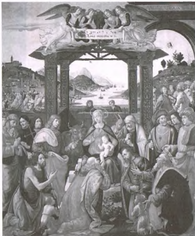
„Pokłon Trzech Królów”, namalował Domenico Ghirlandaio (1449 – 1494)

dzieją się znane z Ewangelii rzeczy, które jednak nie należą do ikonograficznego standardu przy przedstawianiu „Pokłonu Trzech Królów” – zarządza przez Heroda rzeź niewiniątek, widoczna po lewej stronie obrazu. U góry po prawej stronie