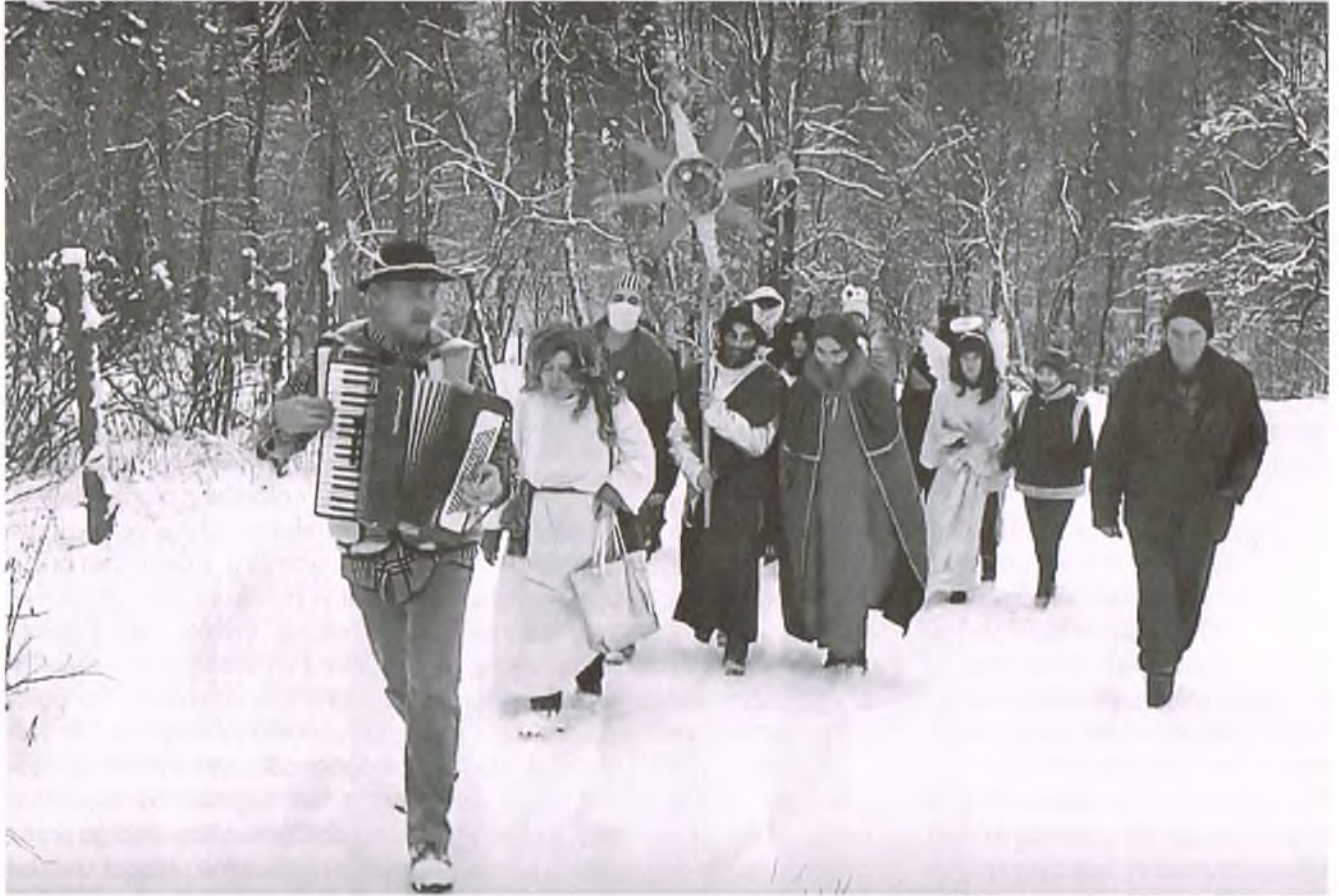
Kolędnicy w Polanie (strona internet. „Nowy Rok dla naszych przodków...”)

Przełom starego i nowego roku w obrzędowości ludowej był niezwykle ważnym czasem, i podobnie jak dzień Wigilii w szczególny sposób rzutował na przyszłość. W najlepszy sposób potwierdza to ludowe porzekadło „jaki Nowy Rok – taki cały rok”.