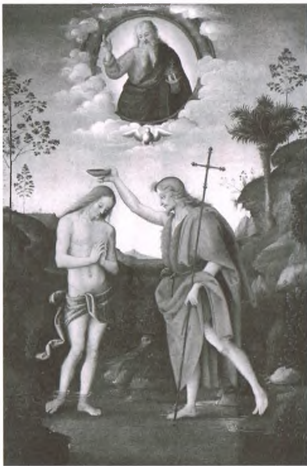
Chrzest Chrystusa w rzece Jordan

W życiu ludzkim, również religijnym, ważna jest inicjacja i rytuały. Taki charakter miał chrzest Jana. Wprowadzał do wspólnoty tych, którzy oczekiwali bliskiego przyjścia Mesjasza. Chrzest poprzedzało wyznanie grzechów. Następnie zanurzano się w wodzie, pozostawiając w jej nurtach grzechy. Człowiek obmyty wodą łączył się z boskim źródłem życia. Jezus, który nie miał nawet cienia grzechu, nie potrzebował chrztu. Jednak stanął w grupie grzeszników. Wszedł w ludzki świat, jego słabości, nędzę, grzech. „Zbrukał się” niejako wszystkimi grzechami, które pozostawiano w Jordanie, by później ludzi z nich wyzwolić poprzez krzyż.