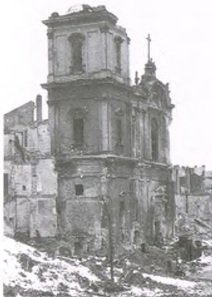
Warszawa, Krakowskie Przedmieście, styczeń 1945 r.

okopcone kotły do prania. Wracali do umarłego miasta, miasta – cmentarza, gdzie ciała ofiar Powstania leżały jeszcze na ulicach, w bramach, na klatkach schodowych. Gdzie szerniały od ognia ruiny pachniały jeszcze spalenizną. Gdzie wiatr nie rozwiał jeszcze do końca dymów płonących domów. Wracali i zamieszkiwali w ruinach, które nie nadawały się do zamieszkania. Bez wody, światła. Bez jedzenia.