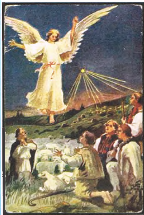
Boże Narodzenie. Anioł zwiastuje (archwialna kartka pocztowa z lat międzywojennych)

Urastaj mi powracaj cieniu domu dalekiego I ty choinko pod oknem światlista Łzo czysta skryta u oka dziś mojogo Raduj się wesel mi się jeszcze Dziecinne moje Boże Narodzenie Po całutkim choćbym szukał świecie Nie wypatrzę gwiazdki tak pierwszej Nie napotkam pasterzy weselszych – Nie ma już zim takich na Ziemi i na Firmamencie Rozpierzchło się przeweseliło Ono śliczne wtenczas świętowanie Łańcuch ludzi aniołów pospołu u stołu – Biel święta na sianie Urastaj wspominaj mi się świątecznie Cieniu domu pierwszego – Mateczniku żywiczny starodrzewiany Przez pokoje twe przeszły pokolenia liczne