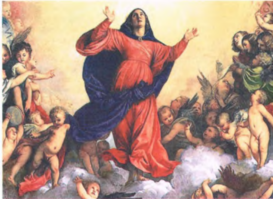
„Assunta” (Wniebowzięta) Tycjana w kościele Santa Maria Gloriosa (Matki Bożej Chwałebnej) w Wenecji, namalowany w l. 1516-18, należy do najpiękniejszych obrazów o tej tematyce

jest stworzeniem najbardziej spełnionym przed Bogiem i upodobnionym do Niego. Ta pełnia człowieczeństwa zajaśniała we Wniebowzięciu Najświętszej Maryi Panny.