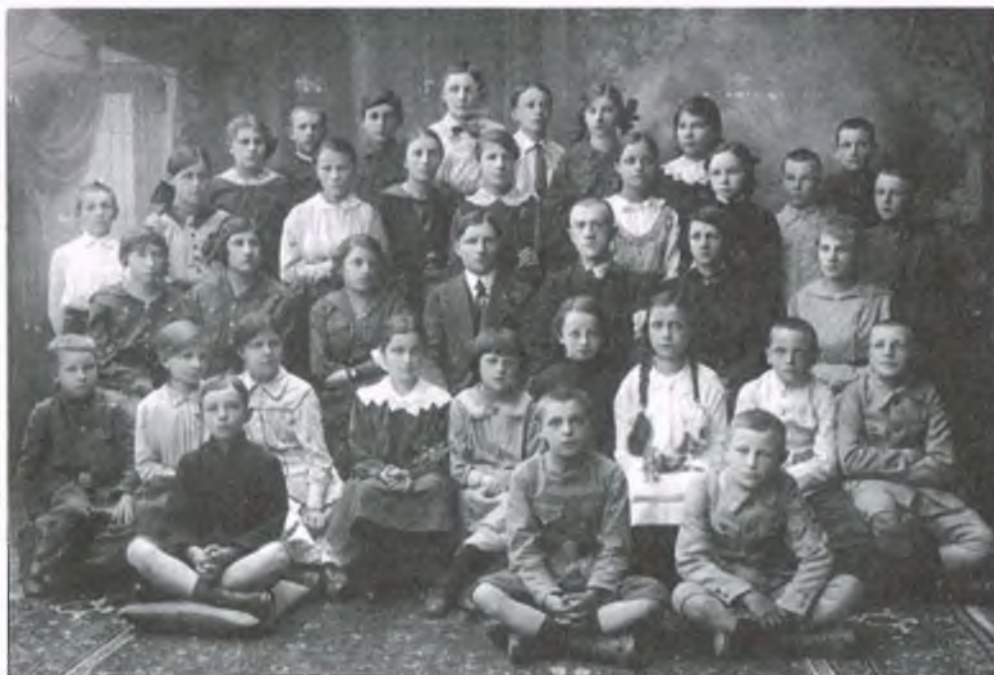
Poltawa na Ukrainie, 1917 r. Drużyna im. Tadeusza Kościuszki

ry posiadał utracony majątek. A jak nikogo takiego nie było, to nie warto „szperać” w przeszłości. Otóż tak wcale nie jest. Najważniejsza w tym doszukiwaniu się jest przecież nasza pamięć i pragnienie zachowania jej na dalsze pokolenia, odkrywanie tamtego świata, którego już nie ma. Czy opowieści o przodkach mogą nas zmienić? Być może, że tak. Warto bowiem w swym życiu coś zmienić, ulepszyć, porównać, do czegoś dążyć. Jest to jednak sprawa indywidualna. Żyjemy teraz, więc wydaje się nam, że cały świat wydarza się akurat teraz. Ale kiedy na nasze zdjęcie z dziś będzie patrzył prawnuk, to jego świat będzie zupełnie inny, a naszego już nie będzie. Dzięki zapisanym opowieściom możemy „ożywić” samych siebie, rodziców, dziadków, kuzynów. Ten zapis może w przyszłości kogoś wzruszyć, komuś w czymś pomóc, uchylić rąbka tajemnicy naszych czasów. Spróbujmy zatrzymać czas.