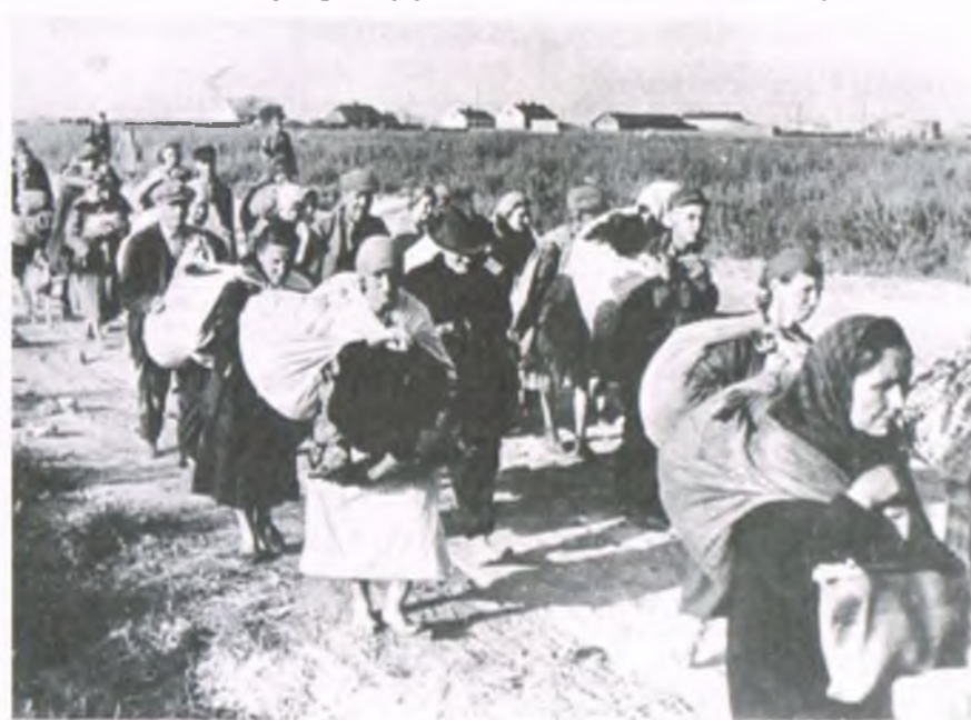
Wysiedleńcy z Warszawy zmierzają do obozu przejściowego w Pruszkowie

Przez lata o tym miejscu i jego historii pamiętali głównie kolejarze tu pracujący i okoliczna ludność. W latach 40. powstał tu