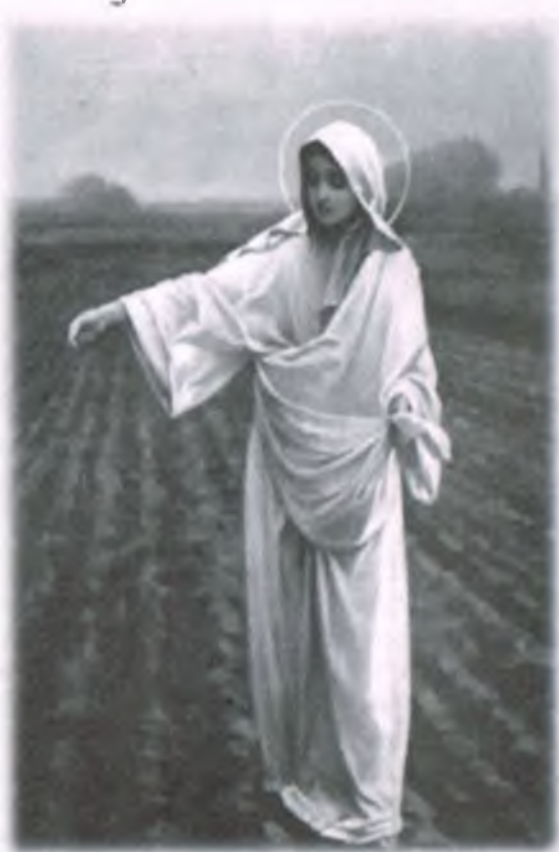
Matka Boska Siewna – obraz Piotra Stachewicza (1858 – 1938). Przedwojenna pocztówka z tekstem, oryginalna

W szarudze pól, w jesiennej mgle, Po rdzawych skibach roli, Stąpają lekko stopy Twe, Jutrzenko ludzkiej doli... Idziesz jasna przez świat, Jako płomyk o północy, Siejąc z rąk drobnych złoty grad Ziarn łaski wiary, mocy... W dusze, co zorał bólu pług, Rozkruszył w proch, rozkrwawił, Rzucasz swych pociech Bożych smug blaskiem Szarudzelzawej.