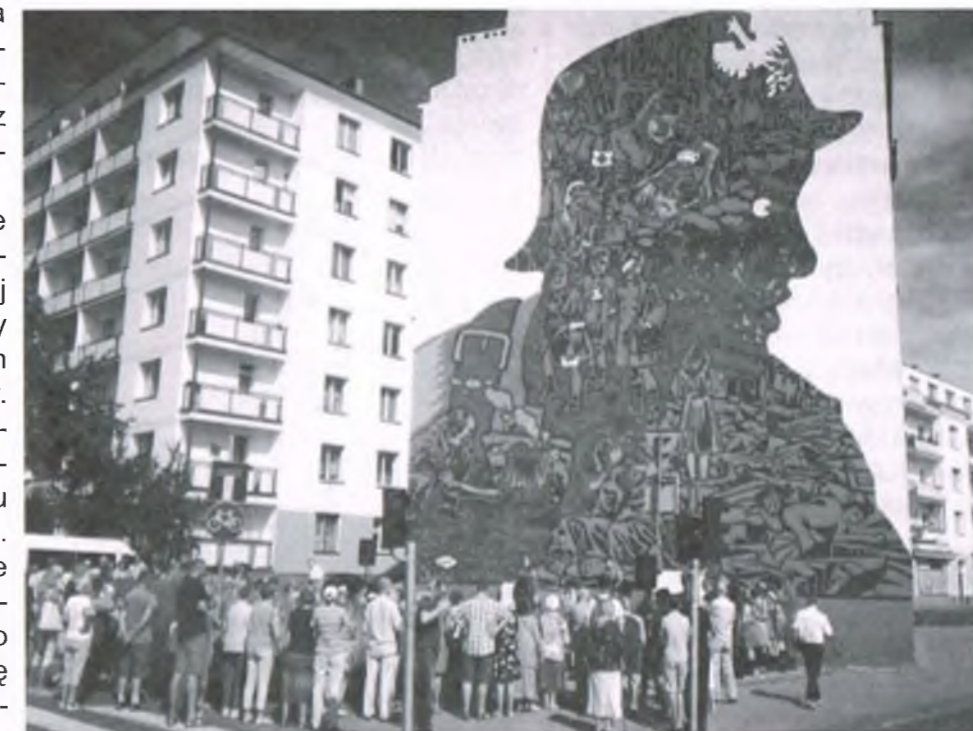
Nowy mural na ścianie przedwojennej kamienicy na rogu ul. Płockiej i Górczewskiej w Warszawie

co jest zrozumiały i trafia z przekazem zarówno do starszych mieszkańców, jak i do młodzieży. Został on zaprojektowany na podstawie fotografii z czasów powstania warszawskiego.