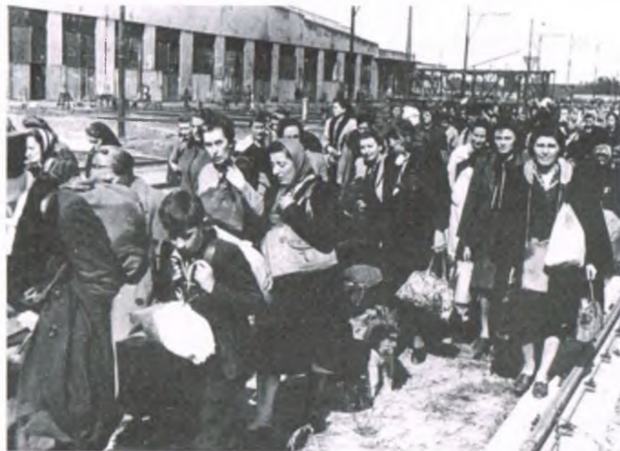
Mieszkańcy Warszawy docierają do obozu w Pruszkowie, wrzesień 1944 r.

Osoby uznane za zdolne do pracy wywożone były transportami kolejowymi na teren III Rzeszy