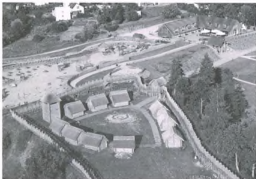
Rekonstrukcja XI-wiecznego grodu w Owidzu w gm. Starogard Gdański

nów, istniejącym głównie w świadomości badaczy historii i pasjonatów zakochanych w epoce średniowiecza. Dziś historia zataczyła koło, jesteśmy bowiem świadkami rekonstrukcji, która z pewnością będzie dumą atrakcji turystycznych Kociewia, odpowiadając na coraz silniejsze zapotrzebowanie społeczeństwa na budowanie nowej tożsamości słowiańskiej.