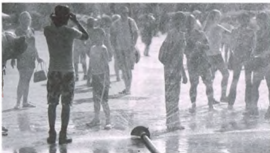
Upały w mieście są poważnym zagrożeniem

Z najnowszych badań naukowców z Hawajów wynika, że nawet, jeśli udałoby się szybko i znacząco obniżyć emisję gazów cieplarnianych do atmosfery, to przed 2100 r. groźne upały będą i tak zagrożeniem dla niemal połowy (48 procent) ludzi na świecie. – Zaczyna brakować nam opcji na przyszłość – twier-