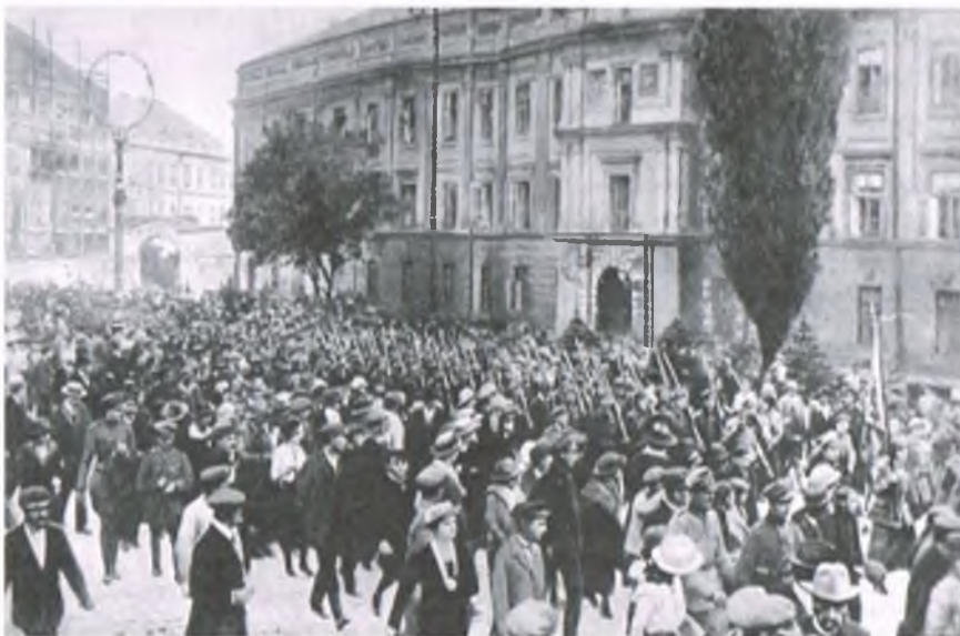
Polscy żołnierze wyruszają na front żegnani przez mieszkańców stolicy

Dla polskiego społeczeństwa zwycięstwo miało znaczenie moralne. Był to pierwszy od 220 lat sukces Polski na arenie międzynarodowej i pierwsza od 220 lat wojna wygrana samodzielnie przez armię polską. Po pięciu miesiącach negocjacji, 18 marca 1921 r. Polska i Rosja podpisały w Rydze traktat pokojowy, który ustalił ostateczny przebieg polskiej granicy wschodniej (na linii Dżisna-Doksyce-Słucz-Ostróg-Zbrucz).