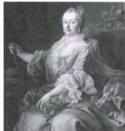
Cesarzowa Maria Teresa

Praktyczną realizację jansenistycznych i febroniańskich projektów reformy Kościoła podjął w krajach korony austriackiej system polityczno-kościelny, zwany józefinizmem. Jego początki w Austrii widzimy już za rządów cesarzowej Marii Teresy (1740 – 1780). Bogobojna władczyni chętnie otaczała