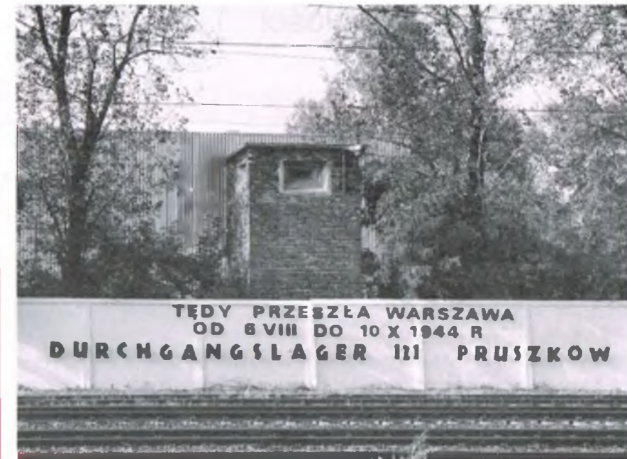
Pruszków – Muzeum „Tędy przeszła Warszawa”

* Generalne Gubernatorstwo – jednostka administracyjno-terytorialna utworzona na podstawie dekretu Adolfa Hitlera z 12 października 1939 r., obejmująca część okupowanego wojskowo przez Niemcy te-