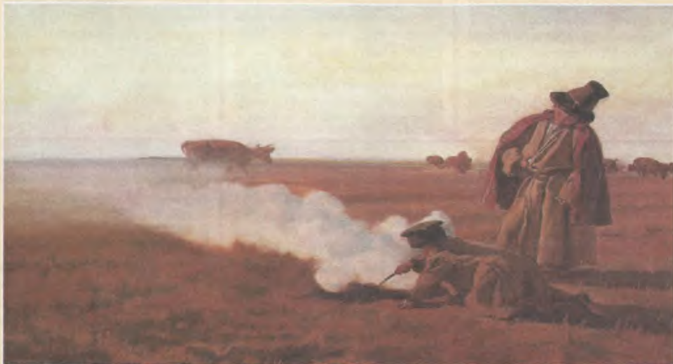
Jesień – obraz Józefa Chełmońskiego (1849 – 1914) herbu Prawdzic

Czas około Narodzenia Matki Boskiej (8 września) uważano za najlepszy do siewu oziminy, i dlatego powtarzano sobie