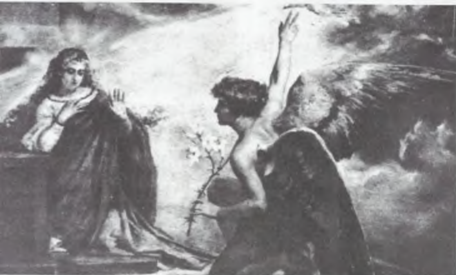
Archanioł Gabriel zwiastował Pannie Maryi – malował Władysław Rossowski (1892 r.), wzorując się na rysunku Jana Matejki

Jego imię Rapha'el znaczy „Bóg uleczył”. W Księdze Tobiasza sam siebie przedstawia jako tego, który znosi modlitwy ludzi przed tron Boży. W historii Tobiasza Archanioł Rafał po raz pierwszy występuje pod postacią ludzką; przybiera pospolite imię Azariasz i ofiarowuje młodemu Tobiaszowi wędrującemu z Niniwy do Raga w Medii swoje towarzystwo i opiekę. Ratuje go w drodze od pożarcia przez wielką rybę, szczęśliwie odbiera pieniądze pożyczone kiedyś od krewnego, którego namawia, aby Tobiaszowi oddał swoją córkę za żonę, lecz ją i wreszcie uzdrawia starego Tobiasza – ojca, przywracając mu nie tylko majątek, ale i wzrok; przepędza także złego ducha Asmodeusza. Po dokonaniu dzieła, św. Rafał odsłania przed zdumionymi Tobiaszami, ojcem i synem, kim jest: „Ja jestem Rafał, jeden z siedmiu aniołów, którzy stoją w pogotowiu i wchodzą przed majestat Pański”. (Tb 12, 15). Według Ewangelii św. Jana Rafał jest łączony z sadzawką Betesda w Jerozolimie, gdzie dokonywały się liczne uzdrowienia. Święty Rafał Archanioł ukazuje dobroć Opatrzności. Pobożność ludowa widzi w nim prawzór Anioła Stróża.