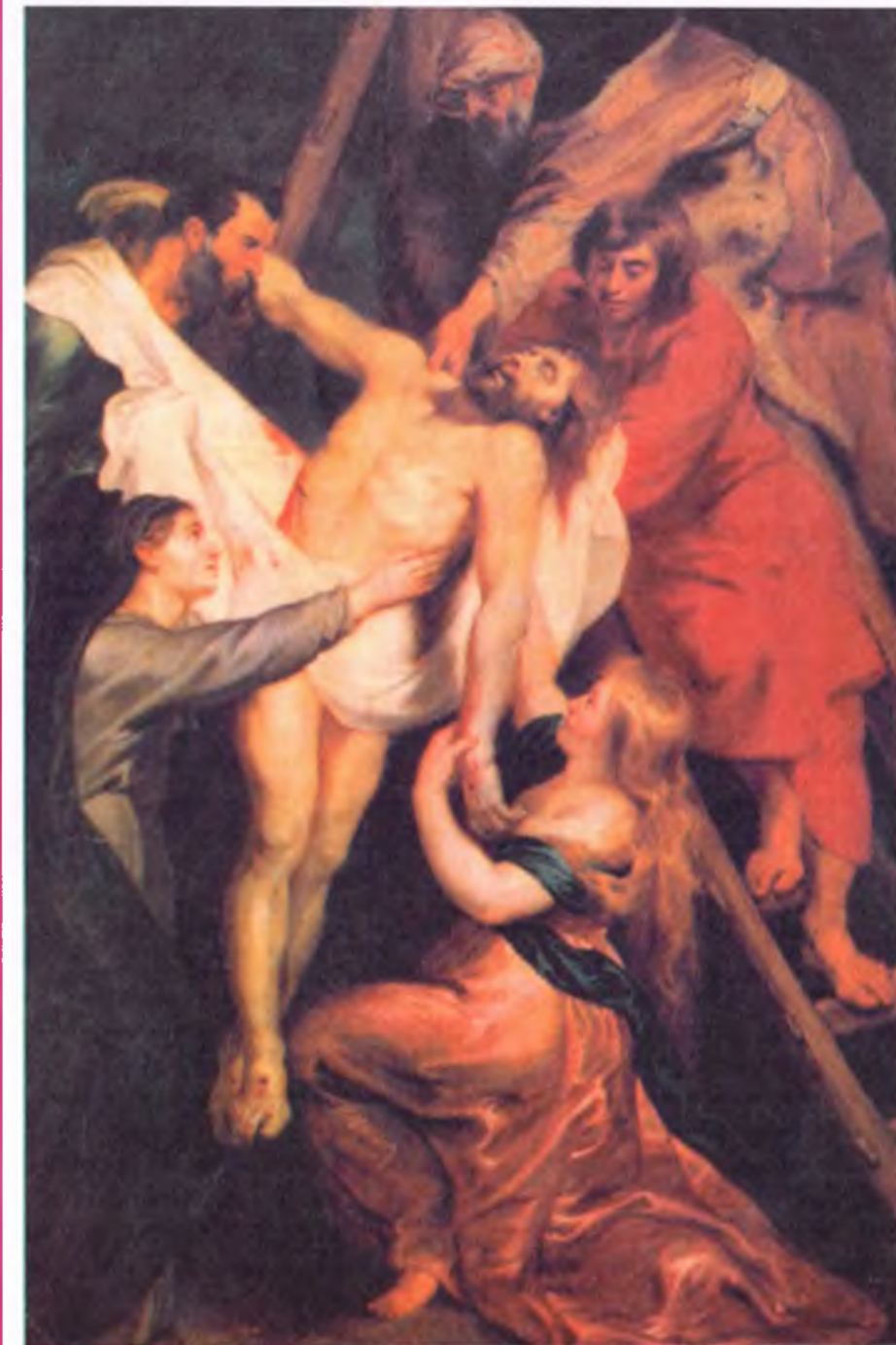
„Zdjęcie z Krzyża” – obraz namalowany przez P. P. Rubensa w 1618 r.