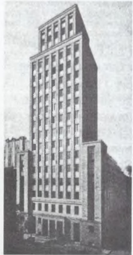
Tak Prudential wyglądał przed wojną

W Prudentialu rodziła się polska telewizja. W 1936 r. na dachu budynku zainstalowano maszt eksperymentalnej telewizji i pierwszy w Europie – zanim to zrobili Niemcy na olimpiadę – nadajnik telewizyjny. Dwa lata później w Prudentialu istniało już profesjonalne studio TV. Jego twórcy planowali, że za kolejne dwa będzie stamtąd nadawany pierwszy program z prawdziwego zdarzenia. Niestety, wkrótce wybuchła wojna, która zweryfikowała ambitne plany.