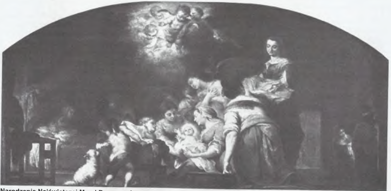
Narodzenie Najświętszej Maryi Panny – obraz namalowany przez Bartolome'a E.P. Murilla (ok. 1660 r.), Paryż (muzeum Luwr)

z tradycji kultu maryjnego. Zgodnie z tradycją uroczystość Narodzenia Maryi obchodzona jest 8 września, a więc dziewięć miesięcy po uroczystości Poczęcia Maryi (8 grud-