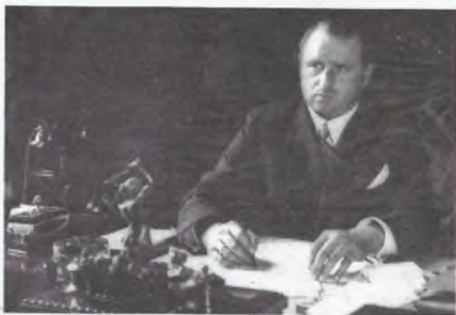
31 lipca 1934 r. Stefan Starzyński został mianowany komisarycznym prezydentem Warszawy. Prezydenta zabiło w Warszawie lub najbliższych okolicach, tuż przed Bożym Narodzeniem 1939 r., trzech gestapowców – ustalił IPN (na zdj. prezydent stolicy w swoim gabinecie, 2 sierpnia 1934 r.)

Za czasów II Rzeczypospolitej powstało kilka śmiałych projektów, które zaowocować miały wzniesieniem w Warszawie kolejnych wieżowców, głównie z myślą o instytucjach państwowych. Niektóre weszły nawet w fazę realizacji. Wykopane zostały na przykład fundamenty pod gmach Polskiego Radia. A potem przyszedł kres starego świata. Dziś możemy oglądać zaledwie jego okruchy. Wieżowiec dawnego towarzystwa ubezpieczeń jest jednym z najpiękniejszych i najbardziej wartościowych.