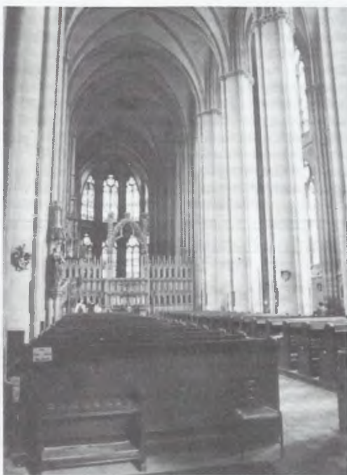
Świątynia pw. św. Elżbiety w Thüringen

dzi na pytania stawiane przez współczesność. Może wnosić swój wkład w dyskurs społeczny, czyli działać jako silna religijnie, moralnie i społecznie instytucja. Będzie to co prawda w otaczającym środowisku dla Kościoła trudniejsze, ale jednocześnie zyska na wadze.