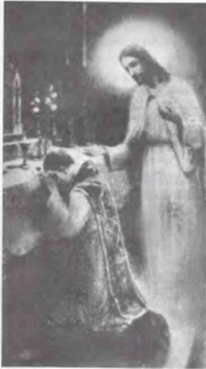
Ilustracja do artykułu „Bóg i człowiek” z archiwalnego egzemplarza Nasze Posłannictwo , nr 9, 1958 r.

skup miał zwoływać 4 razy w roku (§ 37). Natomiast w tekście z 1929 r. (uwzględniającym poprawki Komisji) jest mowa o tym, że „Synod zwyczajny zwołuje biskup z urzędu, regularnie co 7 lat, na jesieni”, a Synod nadzwyczajny w każdym innym czasie w porozumieniu z Radą Synodalną. Sesje Rady Synodalnej biskup miał zwoływać przynajmniej 2 razy w roku. Nadto wprowadzono tu dodatkowe postanowienia stwierdzające, że na czele Kościoła stoi biskup, zwany „naczelnym albo arcybiskupem”, z którym współpracują „biskupi diecezjalni, biskupi sufragani (wikariusze generalni), dziekani, proboszczowie, wikariusze i katecheci”. „Wikariuszem generalnym jest zwykle biskup sufragan lub starszy kapłan mianowany przez biskupa” (wstęp do rozdziału VII). Na uwagę zasługuje także podkreślenie łączności PNKK z Unią Utrechcką (§ 94).