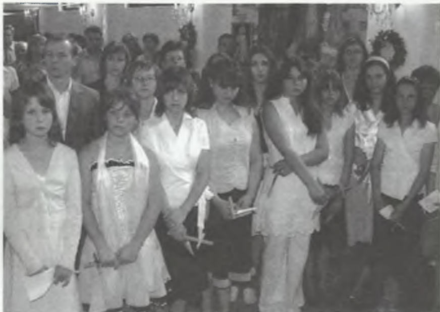
Młodzież i uczestnicy uroczystości