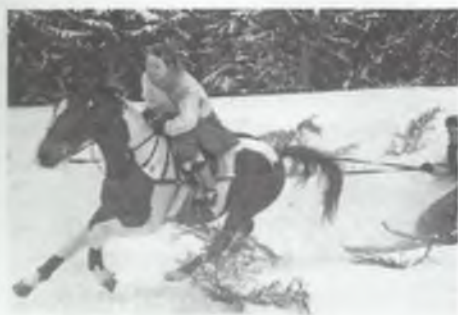
W karnawałowych zabawach biorą udział także gaździny

Któż z nas nie pamięta z dzieciństwa jasełkowych dialogów, w rodzaju: Ostatnie słowo powiadam, na szyję kosę zakładam , albo: Mój Herodku, za twe zbytki, pójdź do piekła, boś ty brzydki .