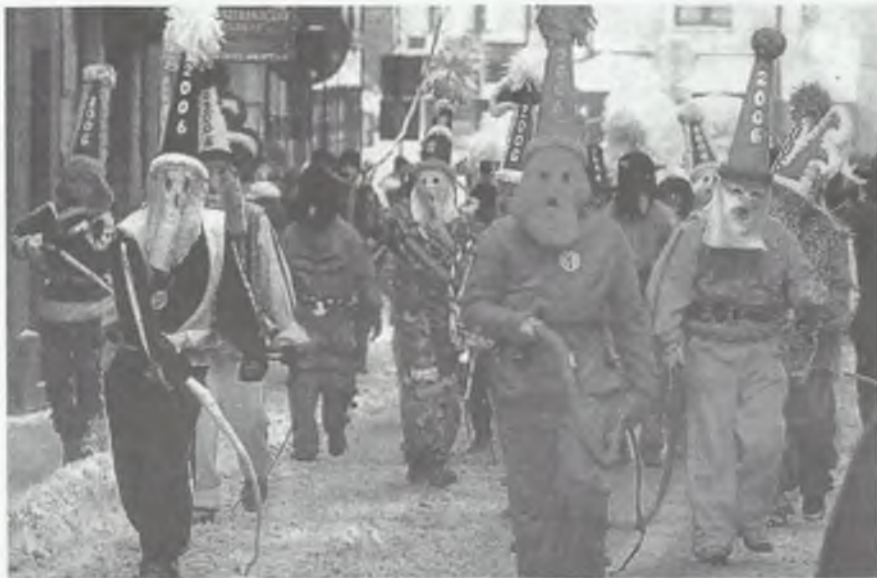
Przebierańcy na ulicach Żywca

dziło im bezkarnie, bowiem wierzono, że wraz w nimi nastanie szczęście i powodzenie. Dziś draby biegają w sylwestra po polach i podwórzach (do domów gospodarze wpuszczają ich niechętnie z obawy przed zniszczeniami). Są wśród nich sznurkarze zwani macidulami, cyganie, nowożeńcy, diabły, śmierć i żyd. Na czele kilkunastoosobowej grupy stoi komendant. Niektórzy noszą drewniane maski, reszta maluje twarze i wkłada dziwacz-