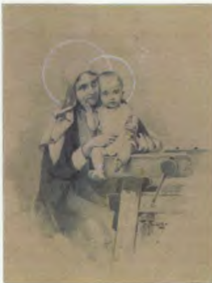
Matka Boska z Dzieciątkiem Jezus — mal. Piotr Stachiewicz (1858-1938)

— A ty się nie będziesz bała Heroda?... — spytała i jak spłoszona przepiórka przypadła pod krzak leszczyny, ale ta zamiast odpowiedzi nakryła Ich swymi gałązkami, otuliła swym gęstym