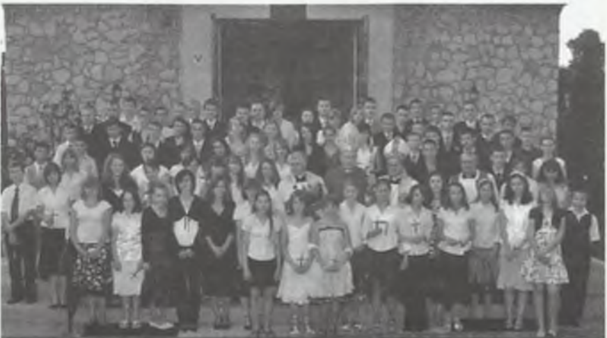
Zatrzymaniem w czasie przepięknej uroczystości było wspólne zdjęcie nowo bierzmowanych z bpem Jerzym Szotmillerem i kapłanami