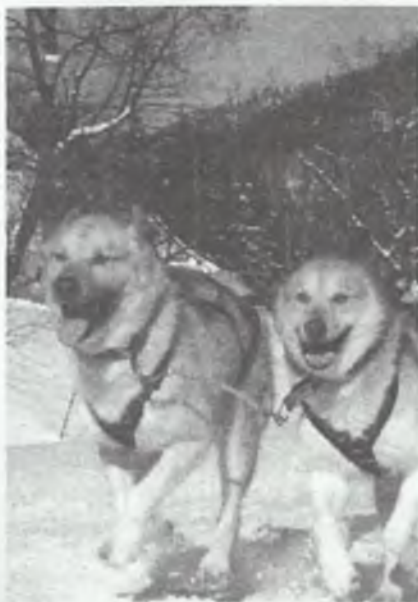
Psy wyruszają na stoki wokół Cisnej

Śpiewaki i szlachcice. W dzień św. Szczepana, od wczesnego popołudnia, zaczyna się „Śpiewanie spoza okna”. Grupa dzieci chodzi od domu do domu i woła pod oknami: „A dacie se ta zaśpiewaj”. Gdy gospodarz się zgodzi, śpiewają kolędy i pastorałki, za co dostają kawałek ciasta i parę groszy. Za śpiewakami podążają szlachcice (kilkunastu kołędników, dziad, baba, szlachcic, masarz, góral, cygan i cyganka z lalką niemowlęciem, Żyd, diabły, śmierć, niedźwiedź i wiele innych. W określonej kolejności wchodzi do domów i wygłasza pełne humoru opowieści, a skrzypek i heligoniści przygrywiają skoczne melodie.