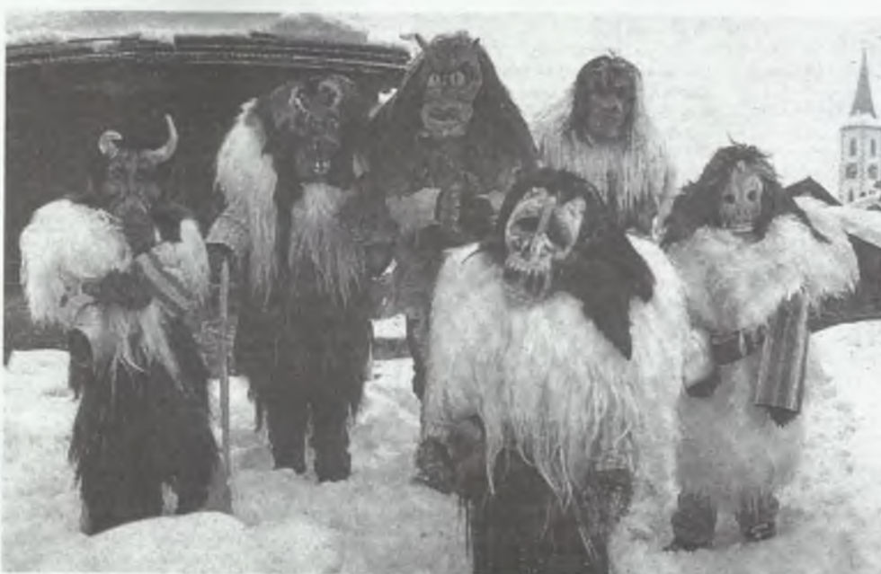
Karnawałowe maski według wzorów sprzed lat w kantonie Wallis