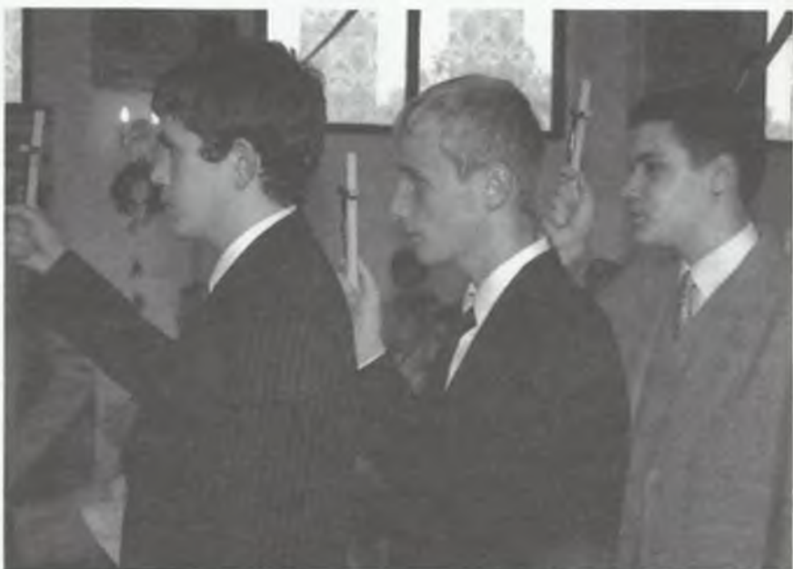
Odnowienie przyrzeczeń Chrztu św., wyznanie wiary oraz przysięga kandydatów do sakramentu bierzmowania