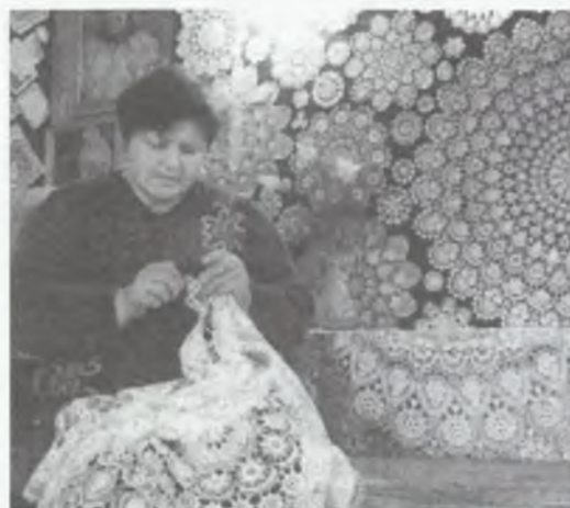
Piękne polskie koronki

Tajemnice heklowania obrusów przechodzi u górali z Istebnej i Koniakowa z pokolenia na pokole-