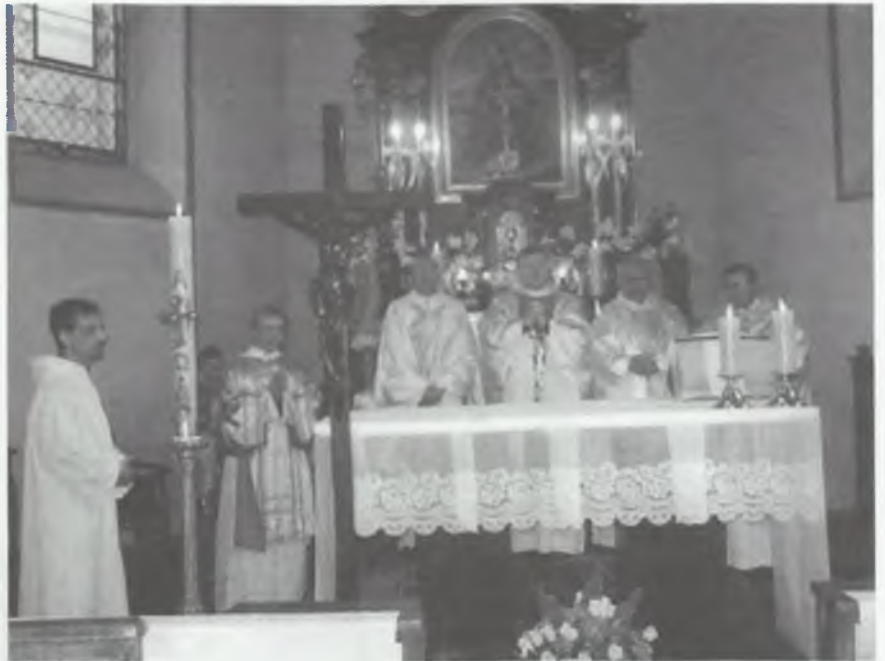
Msza św. koncelebrowana w świątyni w Ząbkowicach Śląskich

W niedzielę, 9 września 2007 r. parafia pw. Narodzenia NMP w Ząbkowicach Śląskich obchodziła uroczystość swoje święto patronalne.