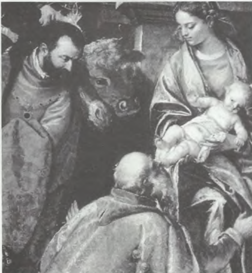
Pokłon Trzech Króli — mal. Veronese (1528-1588)

na blade czoła pochylone nad księgami mądrości i czarne dłonie spracowane pługiem i młotem: