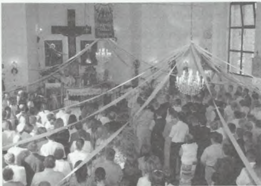
Wnętrze świątyni podczas uroczystości

Sakrament bierzmowania jest sakramentem dojrzałości chrześcijańskiej, która wiąże się nierozdzielnie z odpowiedzialnością za wyznawaną wiarę, pogłębianie jej, świadczenie życiem, a jeśli trzeba — także obroną. Sakrament bierzmowania jest darem, w którym Duch Święty nie tylko umacnia ochrzczonego w mężnym wyznawaniu wiary, ale również obdaruje swoimi darami: mądrości, rozumu, rady, męstwa, pobożności, umiejętności, bojaźni Bożej.