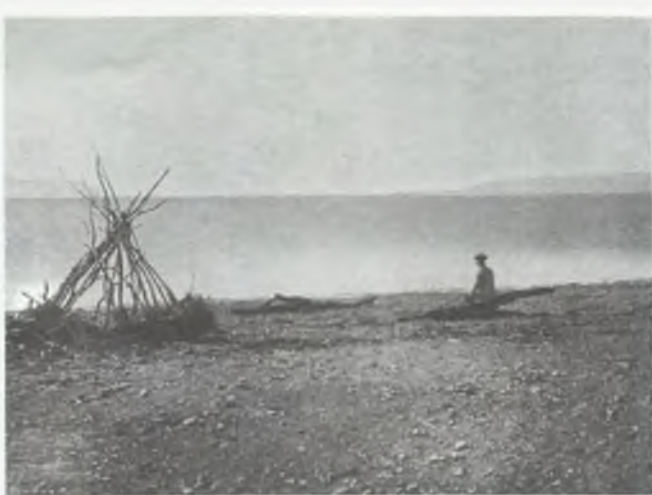
Morze Martwe (fot. z albumu r. 1900) Ziemia Święta

Apostoł — słowo to pochodzi z języka greckiego od „apostolos” (w języku hebrajskim odpowiada mu „shaluah” lub „shaliah”) i oznacza wysłańca. Stąd też „apostolem” nazywano zwykle człowieka, którego wysłano, by omówił sprawy dotyczące zawarcia małżeństwa, lub aby zakomunikował wyrok sądowy. Natomiast „apostolami” w znaczeniu religijnym byli prorocy i inni wysłannicy Boga. Również Najwyższa Rada (Sanhedryn) posiadała swych „apostolów”, przekazujących decyzje tego organu władzy izraelskiej Żydom mieszkającym poza Jerozolimą, a zwłaszcza w diasporze.