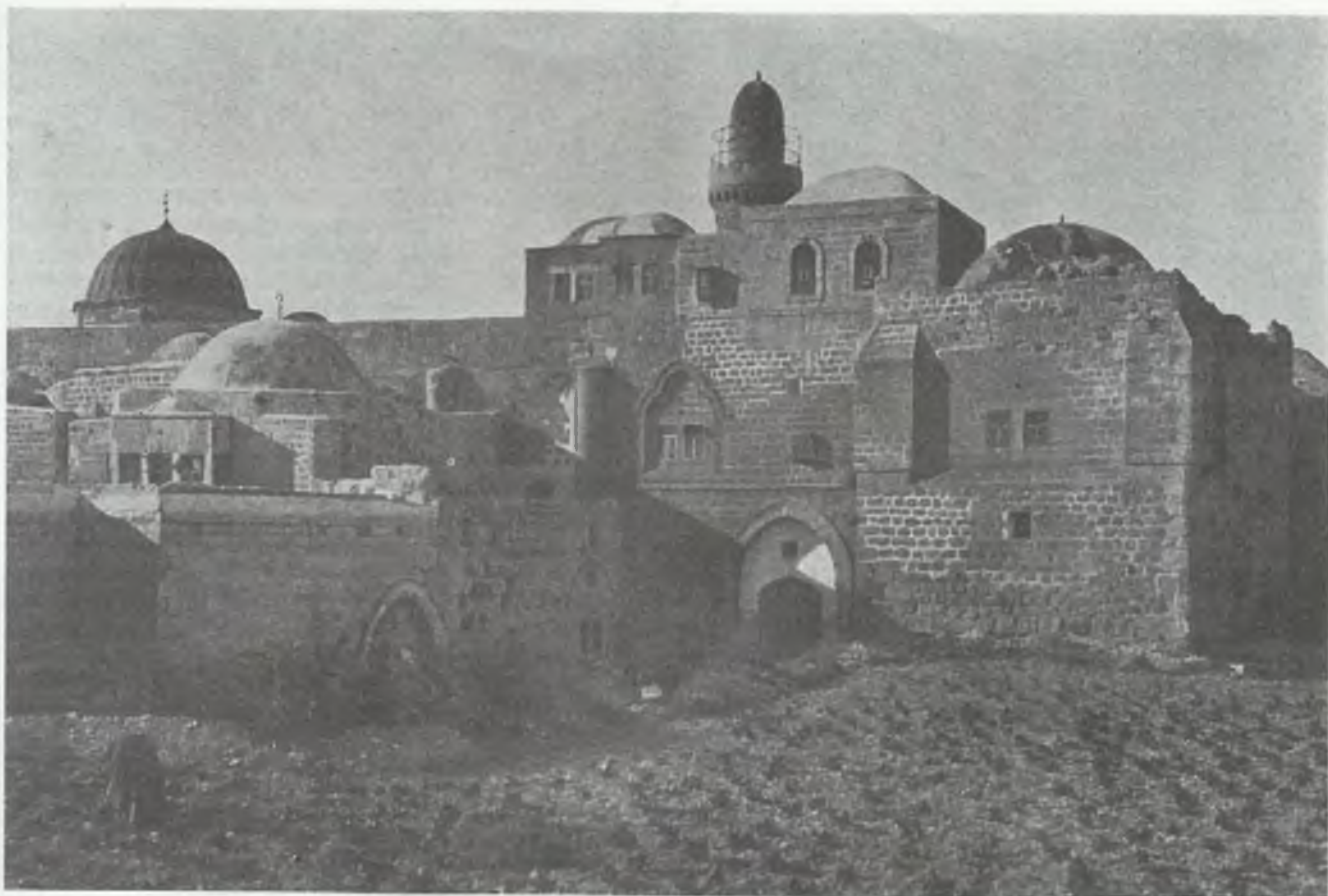
Jerozolima (południowa część). Plac Świętej Dziewicy (fot. z r. 1900)