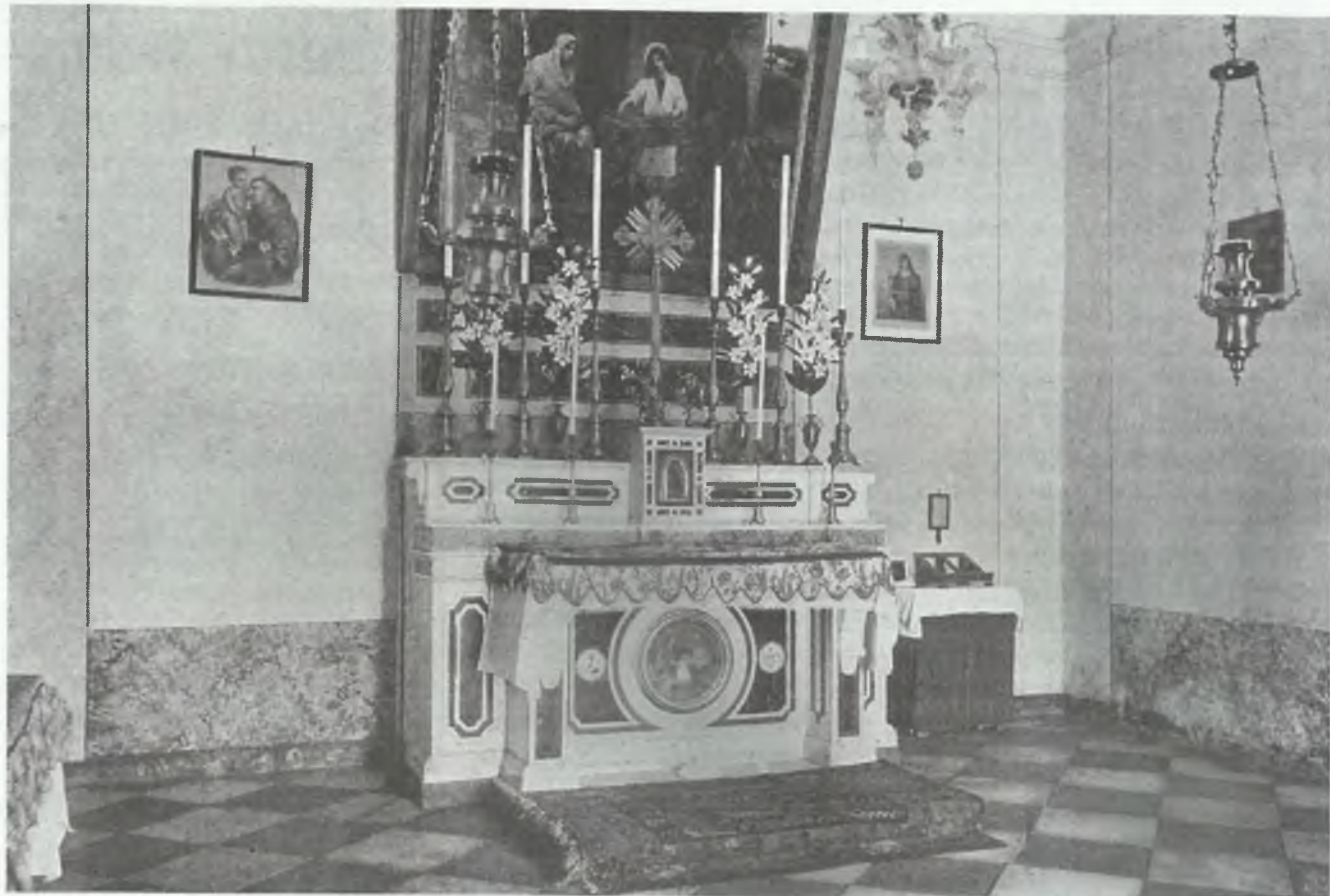
Nazaret. Świątynia w miejscu, gdzie dawniej mieścił się warsztat św. Józefa. W Nazarecie zamieszkiwała Święta Rodzina (fot. z r. 1900)

W Nazarecie, w skromnych warunkach palestyńskich, toczyło się życie rodzinne, ubogacone obecnością Syna Bożego i opromienione licznymi cnotami. Bowiem od chwili powrotu do Nazaretu rozpoczęło się trwające osiemnaście lat życie ukryte Jezusa na łonie Rodziny nazaretańskiej. Święta Rodzina, a więc ta, w której wychowywał się i wzrastał Jezus, stała się wzorem dla wszystkich rodzin chrześcijańskich wszystkich pokoleń i czasów.