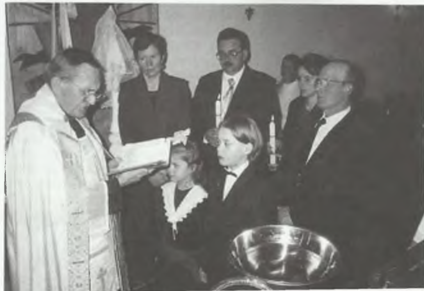
Katechumeni składają wyznanie wiary