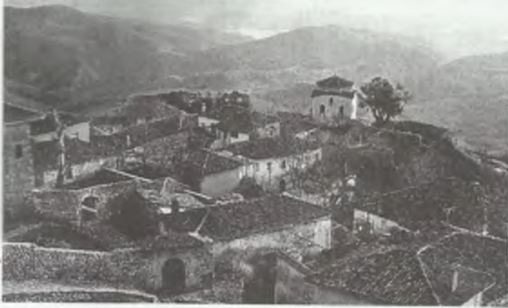
Albania. Domostwa, jak gniazda, usytuowane w górach

ambasador w Izraelu, który nie przypomina sobie zamachów na turystów zagranicznych. Jednak Departament Stanu USA odradza swoim obywatelom podróże do Izraela. Ambasada Amerykańska w Tel Awiwie wystosowała ostrzeżenia do Amerykanów zatrudnionych w Izraelu, aby zachowali maksimum ostrożności i unikali np. w godzinach szczytu restauracji, klubów oraz innych miejsc publicznych. Jednak turystyka przynosi dochody tak wielu ludziom, że na bezpieczeństwie turystów zależy obu zważnionym stronom — izraelskiej i palestyńskiej. Aby to udowodnić, Ministerstwo Turystyki Izraela zaprosiło pod koniec lutego br. dziennikarzy na III Forum Dziennikarzy Turystycznych w Tel Awiwie. Jak wyglądały wtedy szlaki turystyczne w Ziemi Świętej?