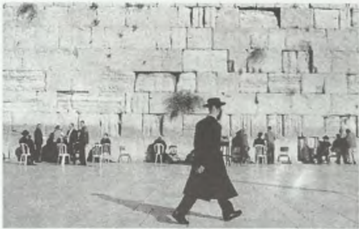
Israel. Ściana Płaczu — najświętsze miejsce judaizmu

Brak wiedzy o sytuacji politycznej kraju, do którego jedziemy, może jednak sprawić, że zamiast na słoneczne plaże, trafimy w ręce terrorystów lub do policyjnych aresztów. Wyjazdy, wbrew zaleceniom MSZ do krajów objętych zbrojnymi zamieszkami, doprowadziły w ostatnich latach do kilku sytuacji, gdy MSZ zaangażowane było w pomoc naszym obywatelom uprowadzonym lub przetrzymywanym wbrew ich woli. Dla naukowców ostrzeżeniem może być wyprawa do Dagestanu dwóch kobiet — profesorów Polskiej Akademii Nauk. Były one przetrzymywane w niewoli przez 208 dni. Kiedy wybierały się do Dagestanu, na granicy republiki z Czeczenią