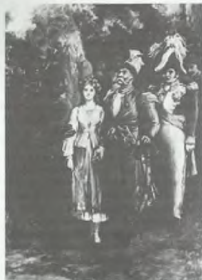
Patrzcie, patrzcie młodzie! Może ostatni, co tak poloneza wodzil!

Polonez przetrwał całe wieki. Uwiecznił go nawet w swym poemacie „Pan Tadeusz” Adam Mickiewicz.