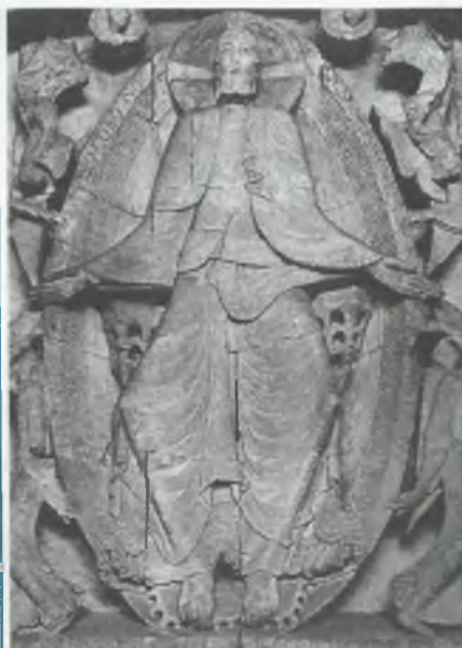
Chrystus z Sądu Ostatecznego, (1130-1135)

W Ewangelii św. Marka czytamy, że Bóg „nie jest Bogiem umarłych, lecz żywych” (Mk 12, 27). Stąd — nawiązując do pojęć żydowskich — mówi się o przyjęciu zmarłych na łono Abrahama, czy do raju (por. Łk 23, 43). A Jezus Chrystus naucza: „Ja jestem zmarłych wstaniem i życiem. Kto we Mnie wierzy, choćby i umarł, żyć będzie. Każdy, kto żyje i wierzy we Mnie, nie umrze na wieki” (J 11, 25-26). Jezus powiada, że i my będziemy tam, gdzie On jest: „W domu Ojca