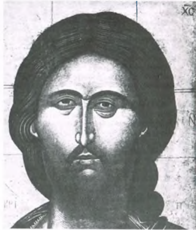
Jednymyślnie wyznajemy, że fundamentem Kościoła jest Jezus Chrystus, jedyny Pan Kościoła. Wszystko to, co pochodzi od Chrystusa — poprzez Apostołów i Tradycję niepodzielnego Kościoła, poświadczoną przez Ojców — należy do jednego Kościoła

W takiej sytuacji nie może być dla nas rzeczą obojętną, jakie stanowisko wobec tych dążeń zajmuje Kościół prawosławny. Niektórzy teologowie prawosławni do niedawna jeszcze twierdzili, że można by przyznać papieżowi jurysdykcję uniwersalną oraz nieomylność w sprawach nauki, ale tylko w ramach Kościoła katolickiego na Zachodzie, natomiast nie stosowałyby się to do Kościoła prawosławnego na Wschodzie. Takie sformułowanie mocno nas zaniepokoiło i jest mało prawdopodobne, żeby zostało przyjęte przez Rzym. Dlatego byłem szczególnie wdzię-