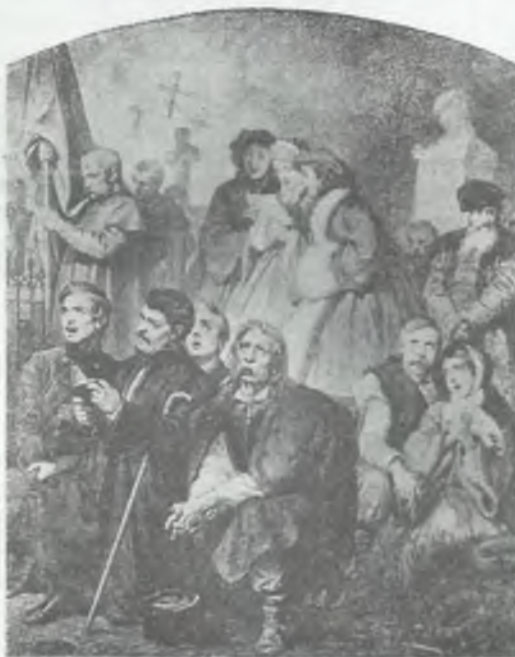
Lud na cmentarzu (mal. A. Grottger)

nie dla mieszkańców wsi: „Gdy gospodarz albo gospodyni umrze, każdy gospodarz, jeśli nie sam, powinien na pogrzeb posyłać jedno z domu swego, wyjąwszy czasu powietrza morowego. Kto nieposłuszny będzie, odłoży do gminy 5 sz., d. Także też, gdy dziecię gospodarskie umrze, czynić ma