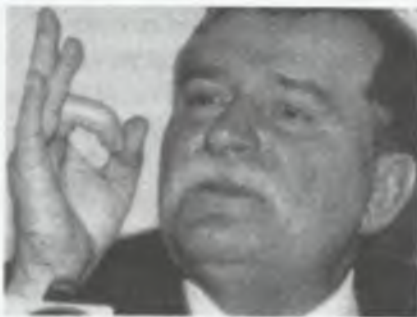
Lech Wałęsa (1990-1994)

Gierka. Tutaj również w 1981 r. członkowie Rady Państwa podpisali akt wprowadzenia stanu wojennego, a dziesięć lat później gospodarzem pałacu został Lech Wałęsa, wybrany w wolnych wyborach na prezydenta Polski.