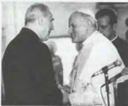
Edward Gierek wita w Belwederze papieża Jana Pawła II (2 czerwca 1979 r.)

Pałac belwederski był świadkiem wielu historycznych wydarzeń. To tutaj w r. 1979 przybył Papież Jan Paweł II, witany przez Edwarda