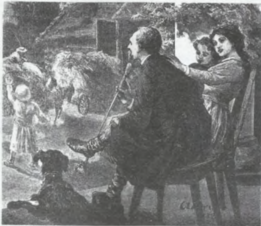
Do stodoły — rys. Andriollego

(Znaczyło to, że z powodu krótszy dni, przestawano dawać czela-