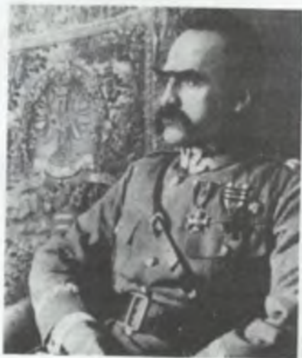
Marszałek Józef Piłsudski (1918-1922 i 1926-1935)

Od r. 1994 prezydenci RP rezydują w większym od Belwederu Pałacu Namiestnikowskim przy Krakowskim Przedmieściu. Oddany po gruntownym remoncie Belweder będzie obecnie służył przyjeżdżającym do Polski głowom obcych państw. Część pałacu udostępniona zostanie zwiedzającym. W podziemiach znajdzie się ekspozycja poświęcona marszałkowi Józefowi Piłsudskiemu.