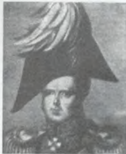
Wielki Książę Konstanty (1820-1830)

Kiedy wielki książę Konstanty, brat cara, przyjechał do Warszawy i objął stanowisko naczelnego wodza polskich wojsk (a było to w r. 1814), zamieszkał w pałacu Bruhla, przy ulicy Wierzbowej. Jednakże ta rezydencja nie odpowiadała wielkiemu księciu. Upatrzył on sobie Belweder, który wówczas należał do rodziny szambelana Onufrego Kickiego. Kilka lat wcześniej szambelan przejął pałac za długi od księcia Józefa Poniatowskiego, dziedzica majątku króla Stanisława Augusta. W r. 1818 rząd Królestwa Polskiego kupił Belweder dla Konstantego. Wtedy rozpoczęła się gruntowna przebudowa pałacu na obiekt, który znamy dzisiaj. Zupełnie nowe — klasycystyczne oblicze nadał mu architekt Jakub Kubicki. Belweder nabrał w rzucie kształtu podkowy otaczającej z trzech stron honorowy dziedziniec. Zasadniczo zmieniły się też wnętrza Belwederu. Kubicki urządził najbardziej reprezentacyjną Salę Niebieską (Pompejańską) w południowym skrzydle pałacu.