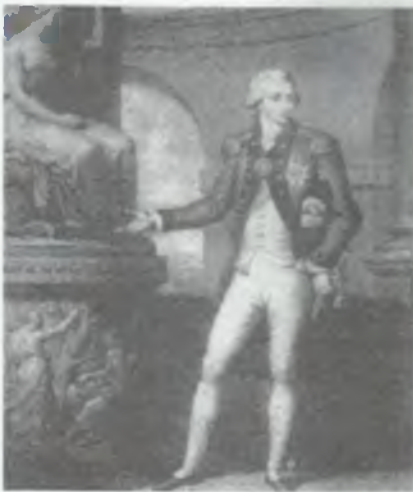
Król Stanisław August Poniatowski (1767-1795)

u znanego architekta Józefa Fontany. Piętrowa willa w stylu późnego baroku kryta była wysokim łamanym dachem. Na środku frontowej i ogrodowej elewacji miała dwupiętrowe występy zwieńczone trójkątnymi szczytami. Po bokach poprzedzającego pałac dziedzińca ustawiono parterowe oficyny.