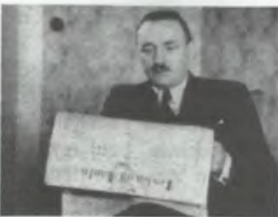
Bolesław Bierut (1945-1952)

Prezydent Bolesław Bierut czuł się w Belwederze tak jak niegdyś wielki książę Konstanty. Kazał nawet oddzielić ogród belwederski od