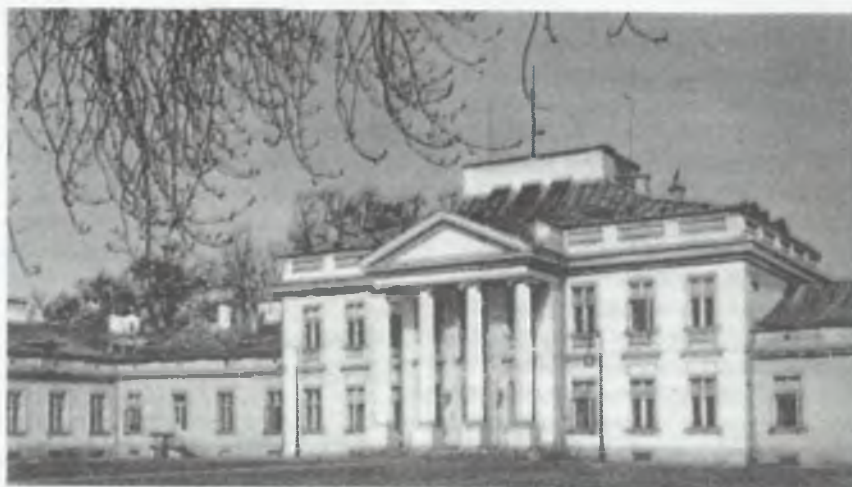
Belweder — fot. z końca lat 30. XX wieku

„Belvedere!” (Cóż za piękny widok!) — zakrzyknęła Klara Izabela de Mailly Lascaris, patrząc z okna wzniesionej przez męża willi. Pochodziła z Włoch, a do Warszawy przybyła jako dama dworu królowej Marii Ludwiki. W stolicy poznała i poślubiła kanclerza wielkiego litewskiego Krzysztofa Zygmunta Paca.