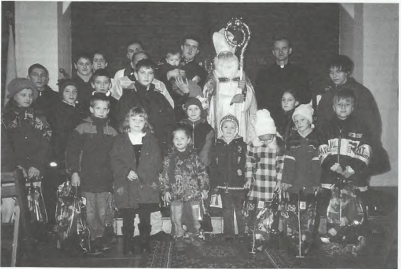
Św. Mikołaj w gronie obdarowanych dzieci