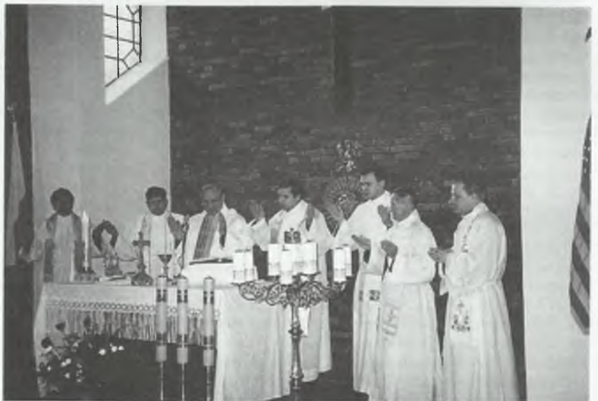
Dzień skupienia dla duchowieństwa

Święty Mikołaj. Dzieci z wielką niecierpliwością oczekiwały chwili powitania z wytęsknionym gościem. Dzięki ofiarności parafian oraz sponsorów Święty Mikołaj obdarował naszych milusińskich słodyczami i owocami.