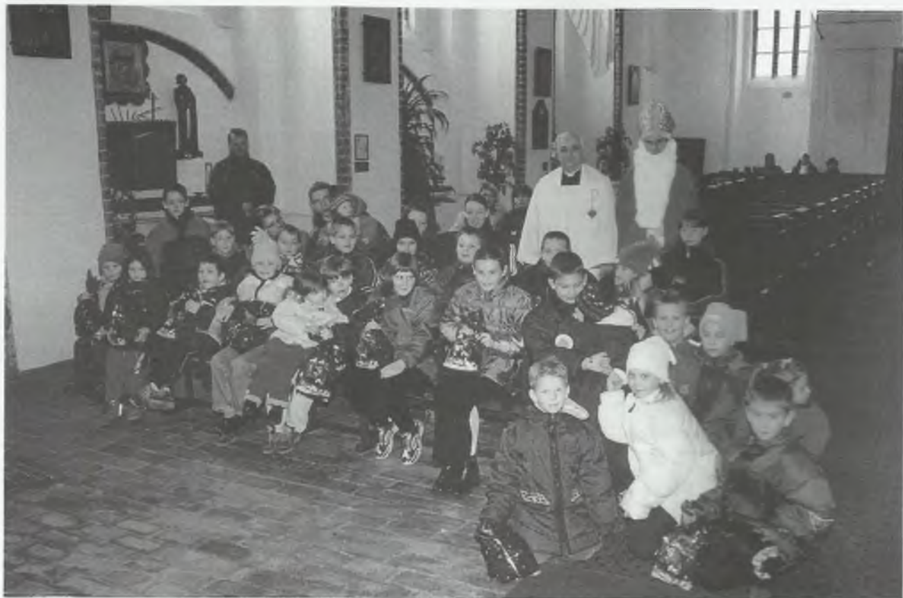
Dzieci podczas „mikołajkowej” uroczystości w szczecińskiej parafii

Św. Mikołaj obdarował 42 dzieci, które z wielką wdzięcznością wyraziły swoje podziękowanie i chętnie pozowały do zdjęcia. Naszym najmłodszym życzymy, by w ich życiu zawsze było wiele radości, poczucia miłości i bezpieczeństwa, dzięki opiece jaką otaczają ich rodziny i Kościół.