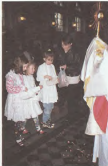
Dziewczynki sypiące kwiatki