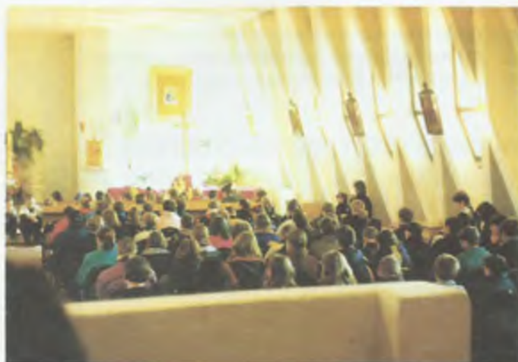
Na nauki rekolekcyjne przybyła do dolnego kościoła ok. 220-osobowa grupa dzieci i młodzieży