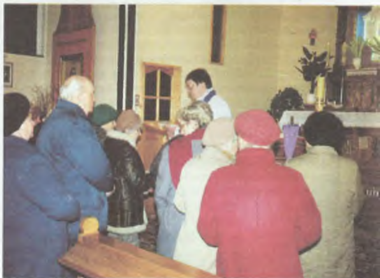
Wierni podczas rekolekcji (Zielona Góra)