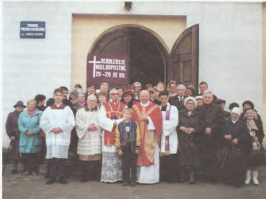
Wspólne zdjęcie duchowieństwa i wiernych po zakończeniu rekolekcji wielkanocnych