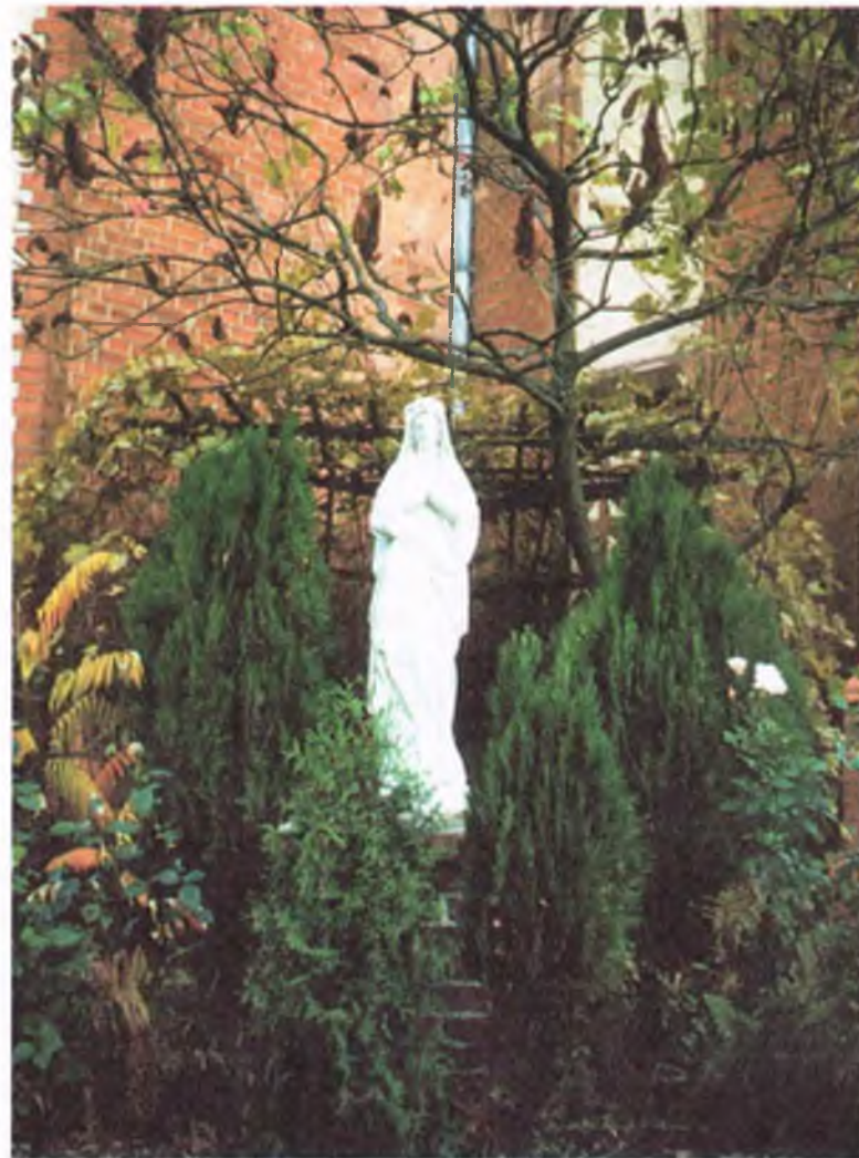
Figura Matki Bożej przy kościele w Żaganie

Zwyczaj odmawiania określonej liczby modlitw sięga czasów starożytnych. Obecny sposób odmawiania różańca pochodzi od św. Dominika (+ 1221 r.), założyciela dominikanów. Według najstarszych podań, Matka Najświętsza ukazała się św. Dominikowi, ucząc go odmawiania różańca i nakazała mu rozpowszechnić tę modlitwę.