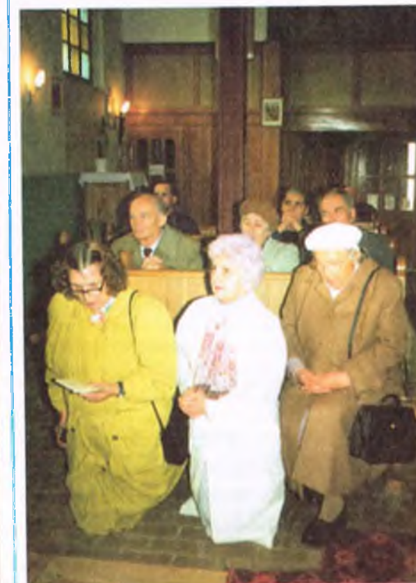
Wierni podczas różańca przy bocznym ołtarzu w świątyni zielonogórskiej