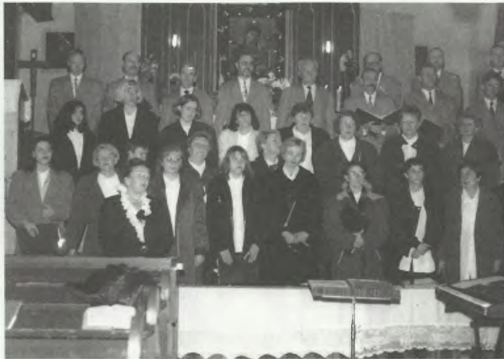
Uczestnicy Koncertu Zaduszkowego w Złotoryji