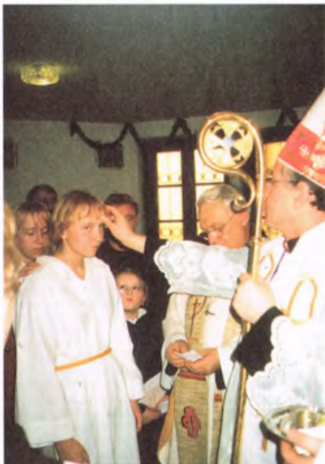
Bp Wiktor Wysoczański udzielił młodzieży sakramentu bierzmowania