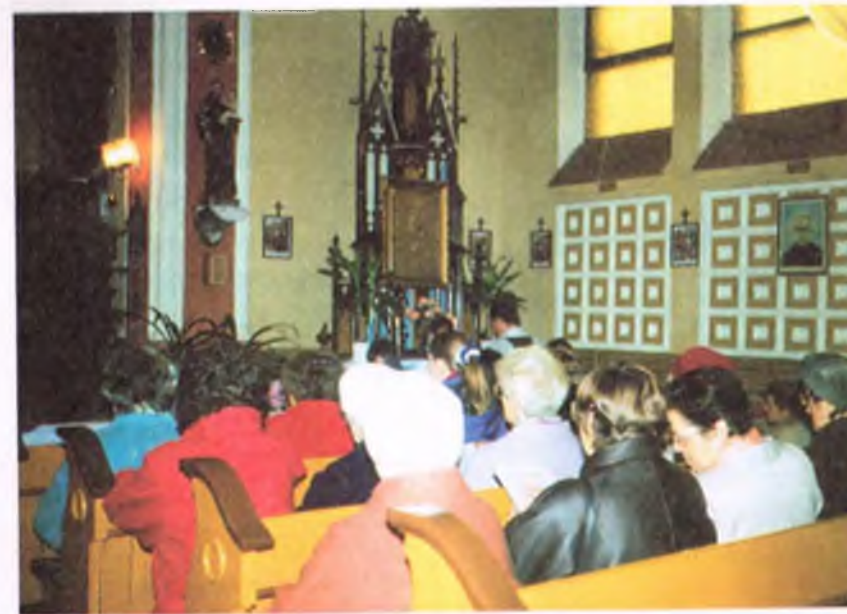
Wierni podczas modlitwy różańcowej przed ołtarzem Matki Bożej w Żaganie

na początku swej pielgrzymki do Polski Ojciec Święty powiedział: „Podczas tej wspólnej modlitwy ekumenicznej prośmy Boga, który jest Ojcem nas wszystkich, aby zgromadził w jedno rozproszone dzieci swoje, aby prowadził je skutecznie po drogach przebaczenia i pojednania dla wspólnego świadectwa o Jezusie Chrystusie, swoim Synu, który jest naszym Panem i Zbawicielem, tym samym wczoraj, dziś i na wieki. Ojczy, spraw, aby wszyscy stanowili jedno” — ut unum sint. (J 17, 21)”. Ks. Stanisław Stawowczyk