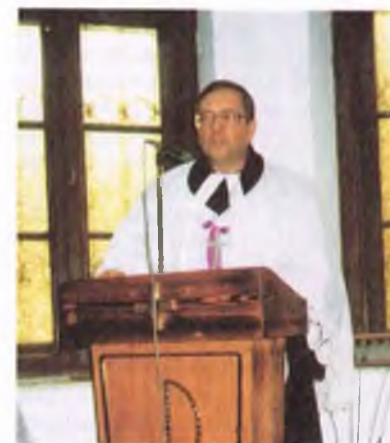
Bp Paweł Anweiler (Kościół Ewangelicko-Augsburski)