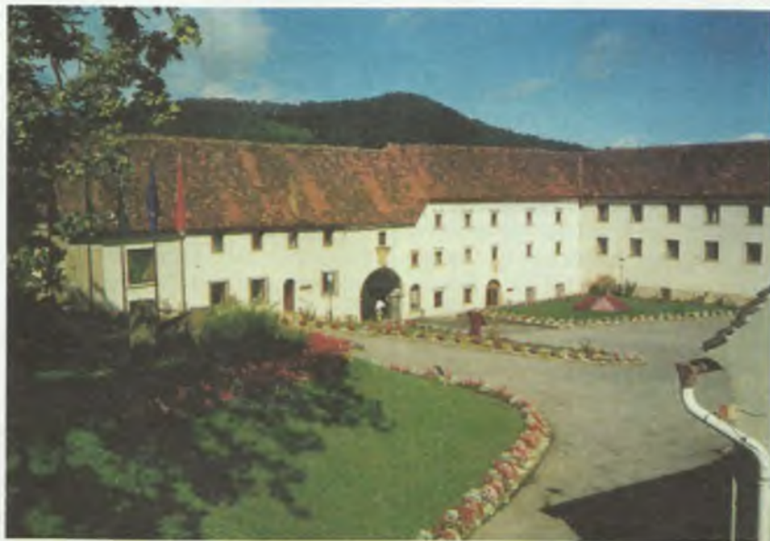
Kongres obradował w malowniczo położonym zamku Seggau