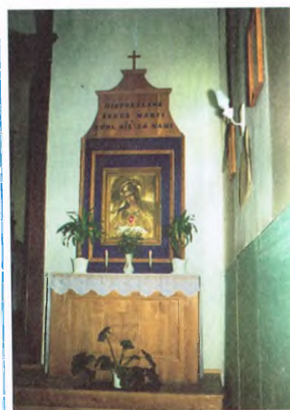
Boczny ołtarz Matki Bożej w Zielonej Górze