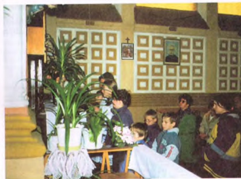
Młodzież i dzieci z parafii żagańskiej