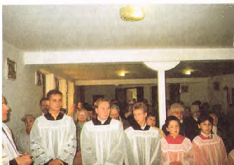
Duchowieństwo i wierni zgromadzeni w świątyni