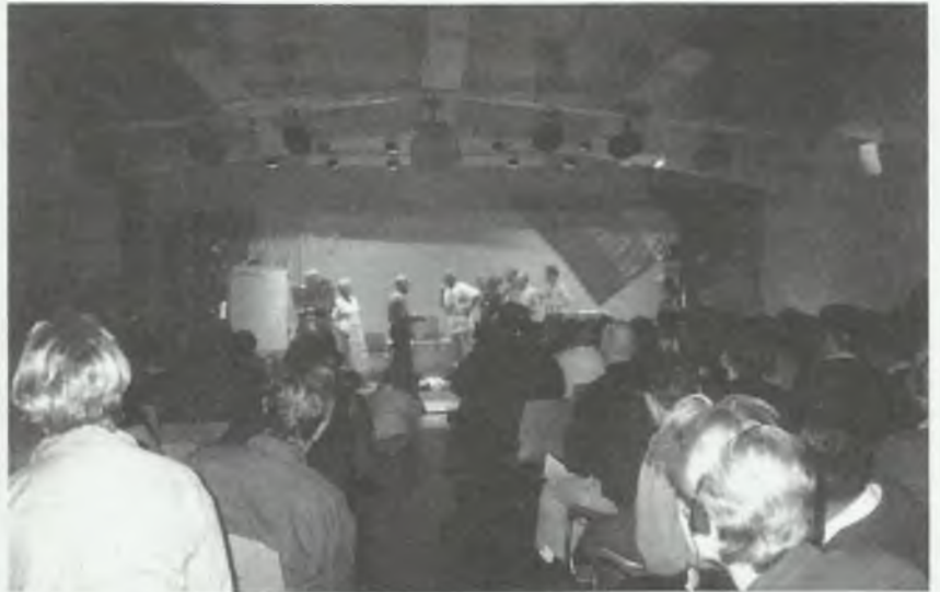
Uczestnicy obrad obejrzeni sztukę teatralną, której treścią był konflikt w gminie korynckiej