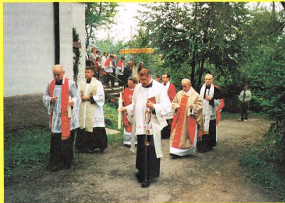
Duchowieństwo w procesji Eucharystycznej prowadzonej przez Ks. Bpa Z. Koralewskiego