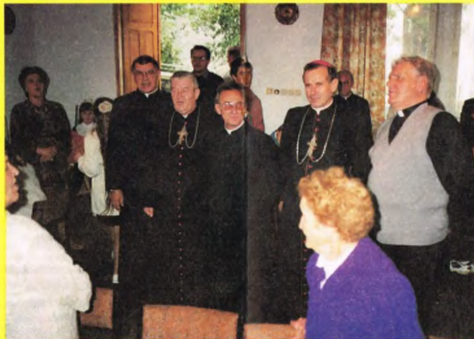
Spotkanie Zwierzchnika Kościoła wraz z towarzyszącym duchowieństwem z parafianami