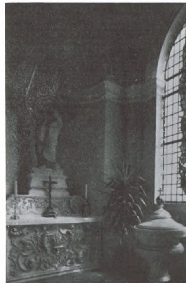
Ołtarz świętego Wita w starokatolickim kościele w Hilversum (Holandia)

We wrześniu 1889 r. między biskupami Holandii, Niemiec i Szwajcarii doszło do zawarcia tzw. Konwencji Utrechckiej, do której jeszcze w tymże roku przystąpił administrator Kościoła w Austrii. Utworzono Unię Utrechcką, do której — w czasie późniejszym — przystąpiły Kościoły powstałe na przełomie XIX i XX wieku oraz po I wojnie światowej w Ameryce i Europie Wschodniej.