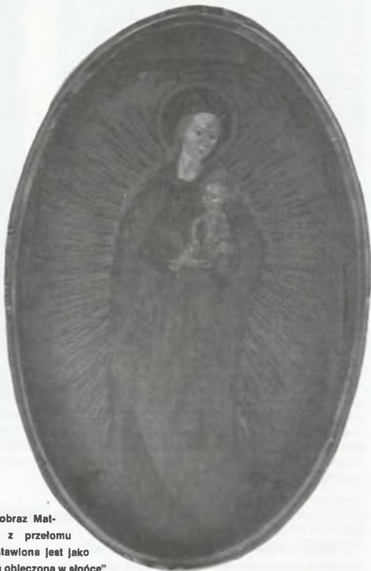
Bogurodzica — gotycki obraz Matki Boskiej Świdnickiej z przełomu XIV/XV w. Maryja przedstawiona jest jako apokaliptyczna „Niewiasta obleczona w słońce”

Twego dzieła Krzciciela, Bożycze, usłysz głosy, napełń myśli człowiecze, Słysz modlitwę, jaż nosimy, A dać raczy, jegoż prosimy: A na świecie zbożny pobyt, Po żywocie rajski przebyt. Kyrieleison.