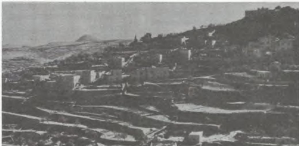
Widok współczesny miasteczka Maryi

Od 1944 roku prowadzę pamiętnik. Wstaję codziennie o 5 rano i robię notatki na temat tego, co przydarzyło mi się w życiu prywatnym i zawodowym. Bardzo możliwe, że niedługo będzie miał Pan okazję przeczytać te moje poranne przemyślenia!