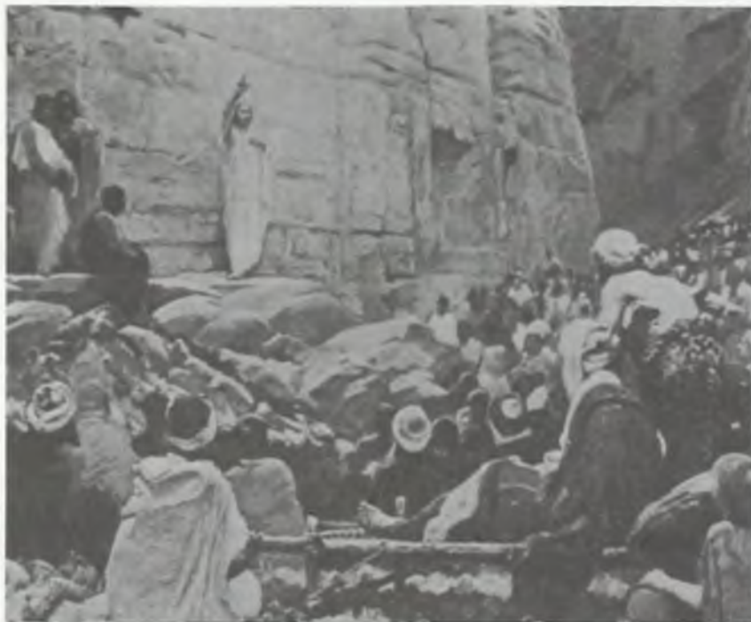
Chrystus nauczający — mal. Paul Buffet

Najbardziej prostym, ale i najbardziej zasadniczym aktem czci Boga jest modlitwa. Jedno z dzieci uczęszczających na katechizację określiło modlitwę, że jest to „takie przytulenie się człowieka do Boga”. To proste, ale jakże wymowne dziecięce określenie, jest czystą prawdą, bowiem modlitwa jest pobożnym wzniesieniem, a więc — jakby przytuleniem się duszy do Boga. To nawiązanie kontaktu z Bogiem.