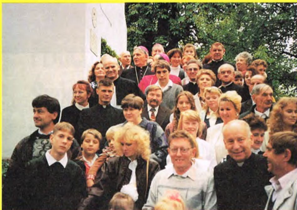
Wspólne zdjęcie po zakończonych uroczystościach — duchowieństwo i wierni