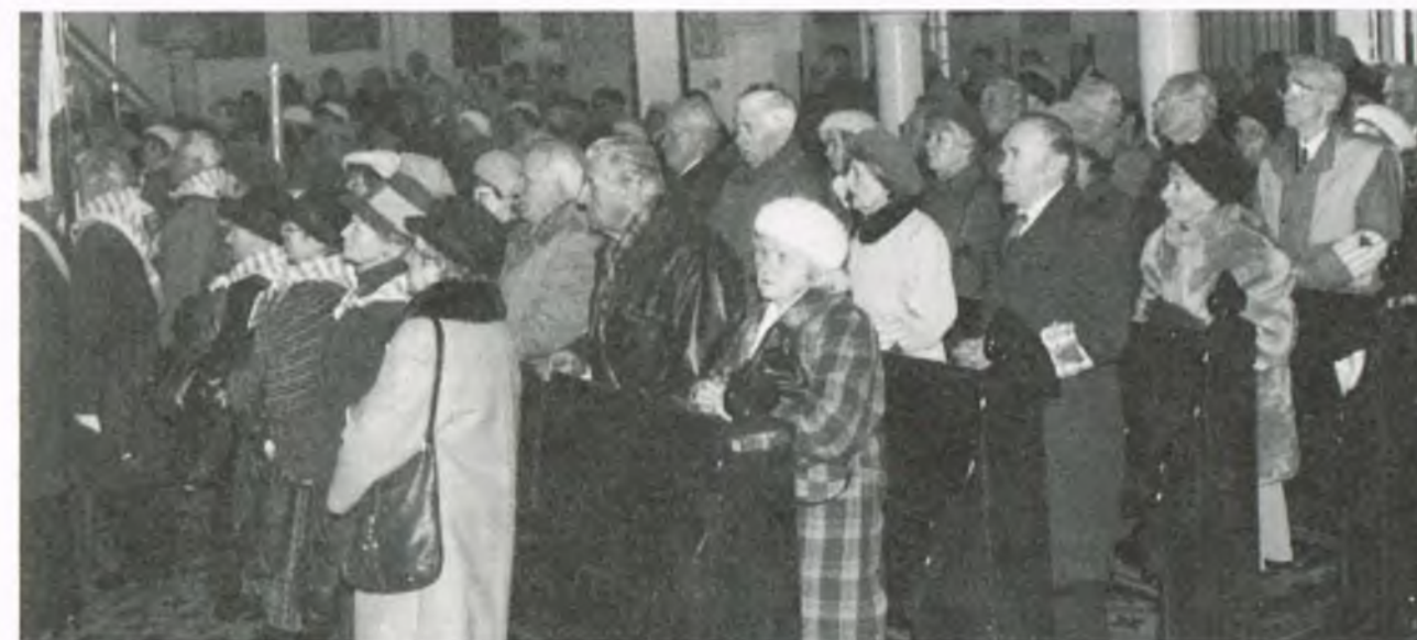
Wierni w czasie Mszy św.