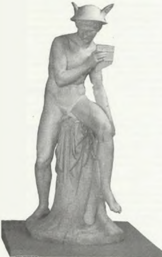
B. Thorvaldsen, Merkury ze zbiorów Artura Potockiego, przed 1826 r.