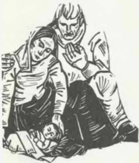
Dawniej nie nadawano dziecku imienia Maria, ponieważ uważano to za świętokradztwo

Warto podkreślić, że okres świąteczno-noworoczny, a po nim — karnawałowy obfitowały w weseliska i chrzcziny, w myśl zasady polskiej tradycji: zastaw się — a postaw się!