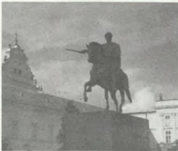
B. Thorvaldsen, pomnik księcia Józefa Poniatowskiego

Bertel Thorvaldsen, który żył w latach 1770-1844, był największym duńskim rzeźbiarzem, a jednocześnie jedną z najwybitniejszych indywidualności twórczych XIX wieku. Jego popularność porównywana była jedynie z nieco starszym od niego Włochem, Antonio Canovą (1757-1822). Obaj reprezentowali w swej twórczości klasycyzm, obaj starali się przenieść w swych dziełach wartości estetyczne sztuki antyku.