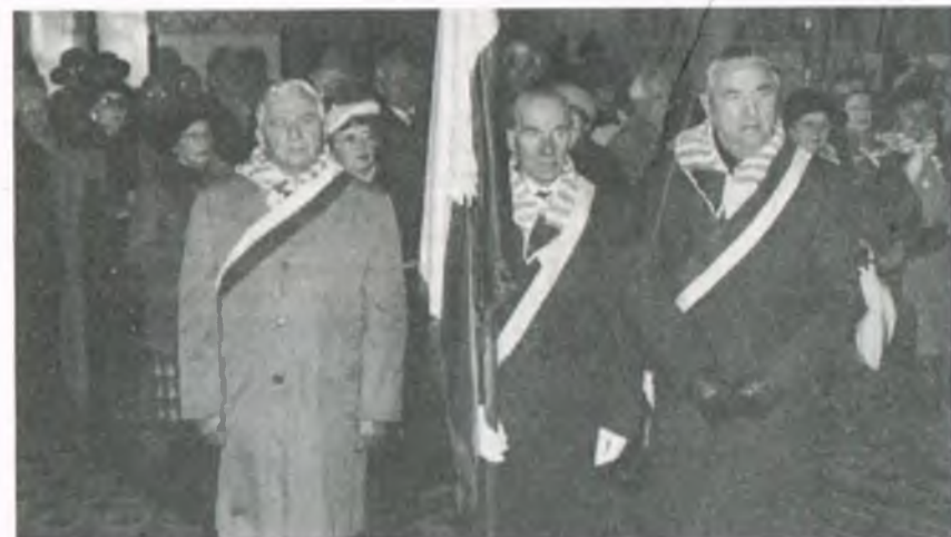
Byli więźniowie obozu Sachsenhausen wystawili poczet sztandarowy