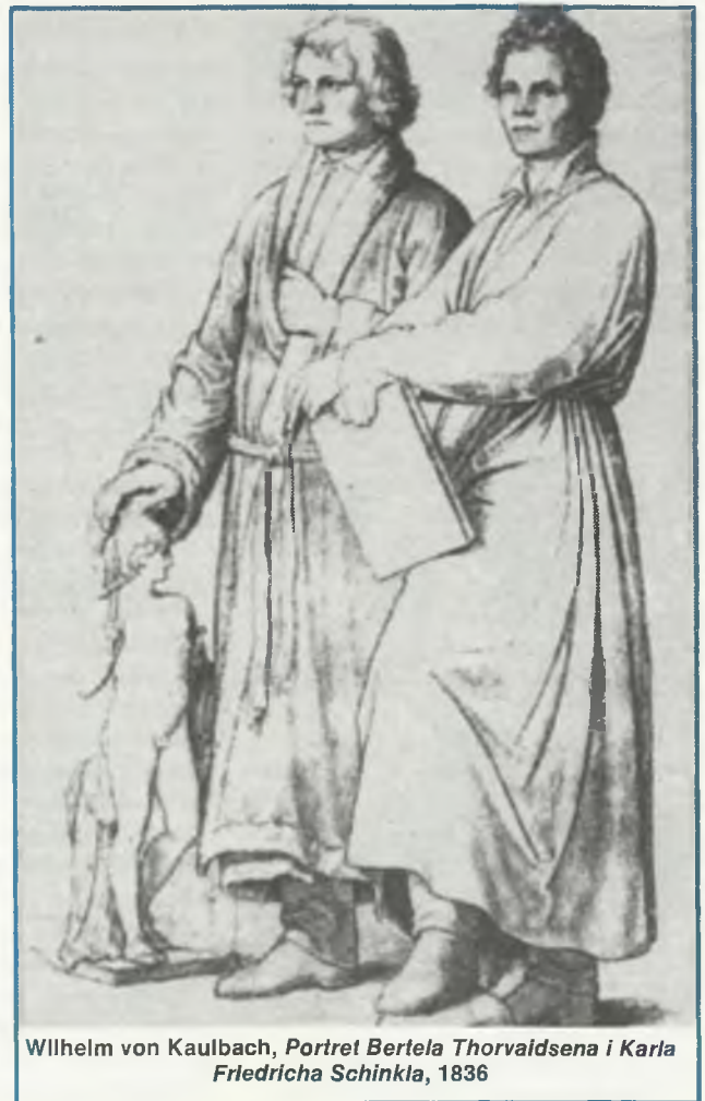
Wilhelm von Kaulbach, Portret Bertela Thorvaldsena i Karla Friedricha Schinkla, 1836