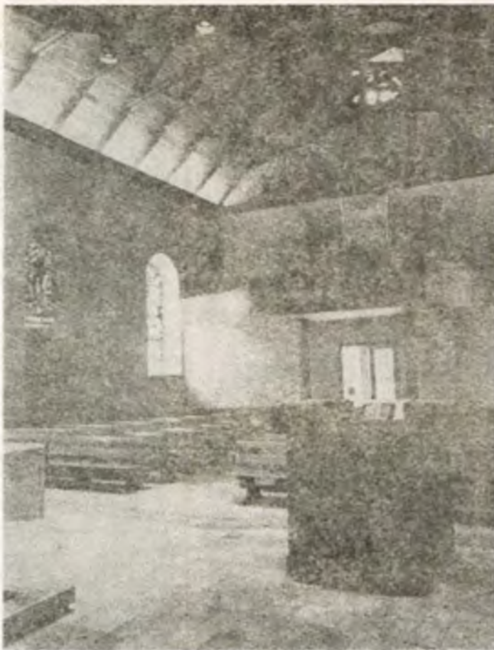
Wnętrze kościoła starokatolickiego pw. św. Piotra w Szwajcarii