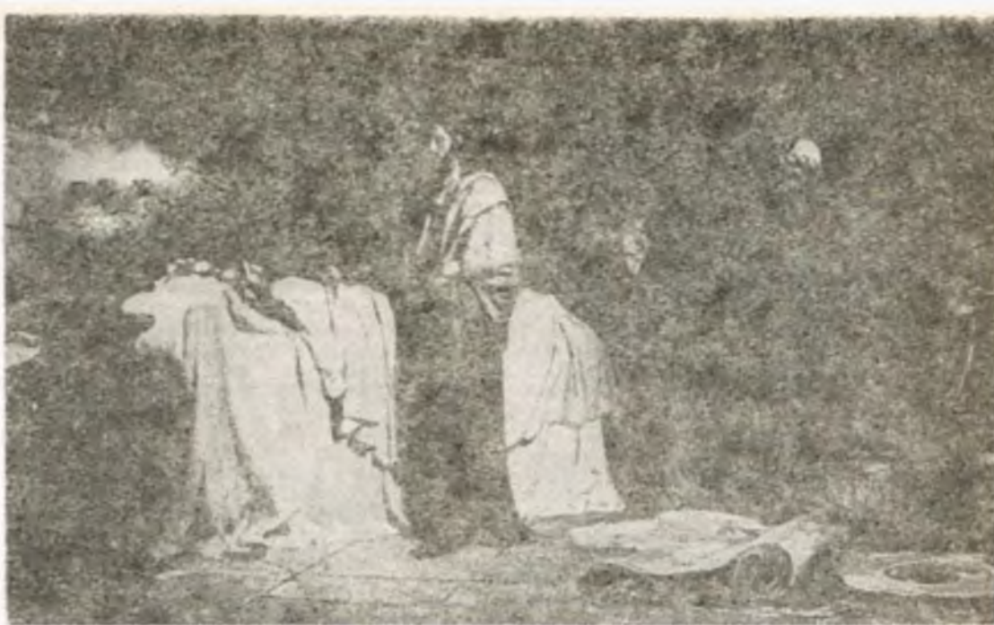
Wskreszenie córki przełożonego synagogi w Kafarnaum

„Gdy (Jezus) posłyszał, że Jan został uwięziony, usunął się do Galilei. Opuścił jednak Nazaret, przyszedł i osiadł w Kafarnaum nad jeziorem, na pograniczu Zabulona i Nef-talego. Tak miało się spełnić słowo proroka Izajasza: Ziemia Zabulona i ziemia Neftalego, Droga morska, Zajordania, Galilea pogan! Lud, który siedział w ciemności, ujrzał światło wielkie, i mieszkańcom cienistej krainy śmieci światło wzeszło ” (Mt 4, 12—16).