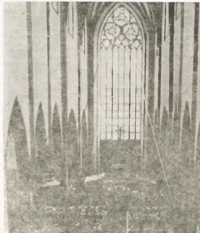
Wnętrze katedry wrocławskiej pw. św. Marii Magdaleny

kluzyczny charakter sekty polega m.in. na tym, iż uważa się ona za „jedyną prawdziwą i żywą Kościół na całej ziemi”. Bez uczestnictwa w tym Kościele nikt „nie może osiągnąć życia wiecznego”. Ponadto sekta stawia ponad Biblię tzw. księgę Mormona, która zawiera objawienie amerykańskiego założyciela sekty Josepha Smitha (1805—1844). Międzynarodowe centrum mormonów znajduje się w Salt Lake