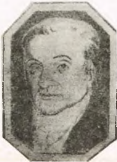
Józef Wybicki, autor „Mazurki Dąbrowskiego”, współtwórca Legionów Polskich we Włoszech.