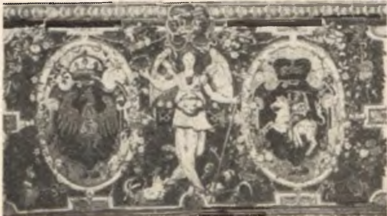
„Orzeł i Pogoń” — arras jagielloński z herbami Polski i Litwy oraz symbolicznym przedstawieniem zwycięstwa.