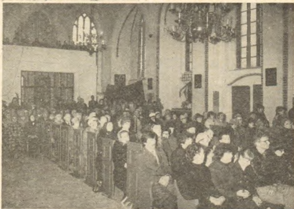
Wierni na nabożeństwie dziękczynnym