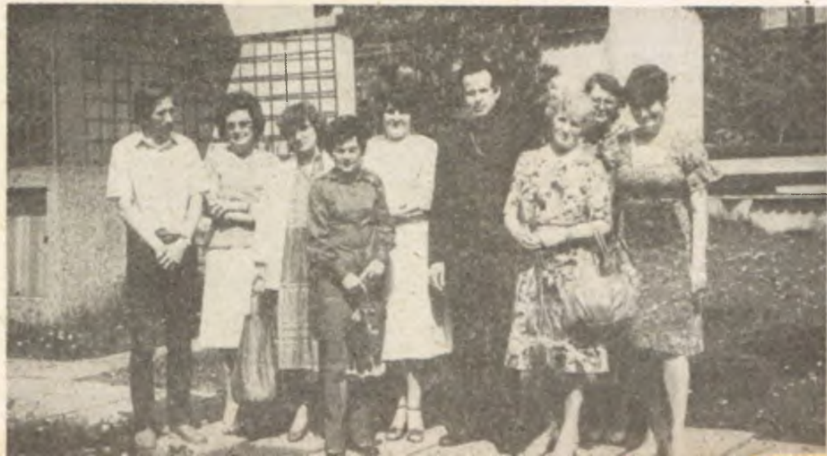
Wspólne, pamiątkowe zdjęcie z Jubilatkami

ustanawia bezpośrednio nie tylko prawa ogólne, którymi świat ma być kierowany, ale i najmniejsze szczegóły. Ma przecież troskę o ptaki niebieskie i każdy włos na naszej głowie. Wykonanie swego planu w szczególach — powierza Bóg człowiekowi, istocie rozumnej, która z pomocą roztropności ma współpracować z Bogiem w doprowadzeniu wszystkiego stworzenia do wypełnienia zamierzonego planu