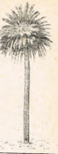
Niezwykle pożyteczna palma daktylowa