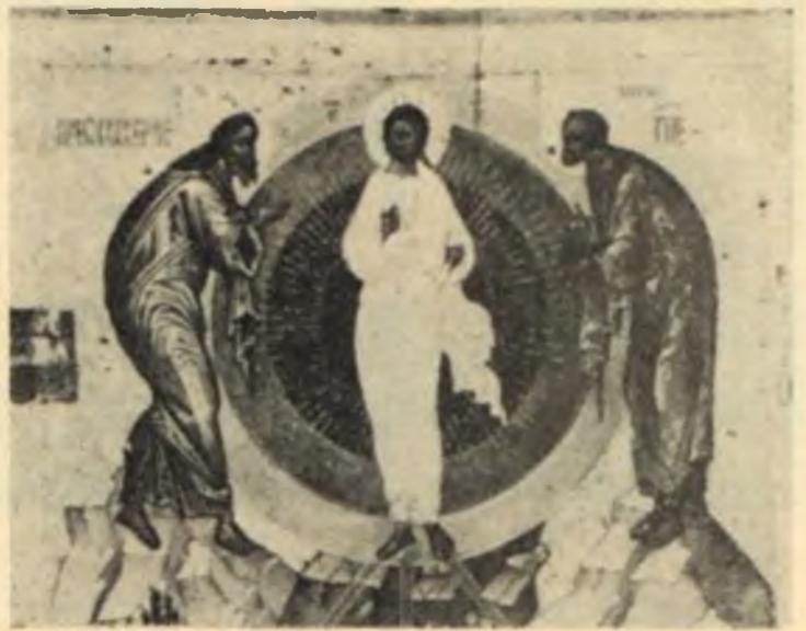
Słowo Objawione wypełnione w osobie Jezusa Chrystusa, w Słowie, które stało się człowiekiem, jest podstawą wiary chrześcijańskiej

Człowiek stracił zaufanie do słowa ludzkiego i ani się spodziewał, jak zachwiał się w wierze Słowu, przekazanemu nam przez Boga, choć na ludzki sposób. Patrzymy dziś na Słowo Boże tak jak na słowo ludzkie. Dlatego wielu ludzi wierzy w Boga, ale uważa, że Bóg potrzebny jest tylko na pewnym etapie