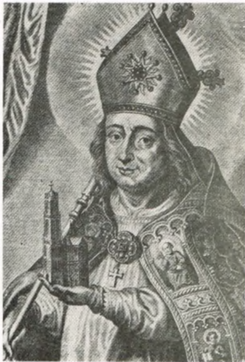
Święty Willibrord (695 – 739) apostół i arcybiskup Fryzji pierwszy rządcą Stolicy Utrechckiej

Numer 17 (922) Tygodnika Katolickiego „RODZINA” jest specjalnym wydaniem poświęconym KONGRESOWI. W niniejszym numerze zamieszczamy dane dotyczące życia i rozwoju niektórych Kościołów Starokatolickich Unii Utrechckiej.