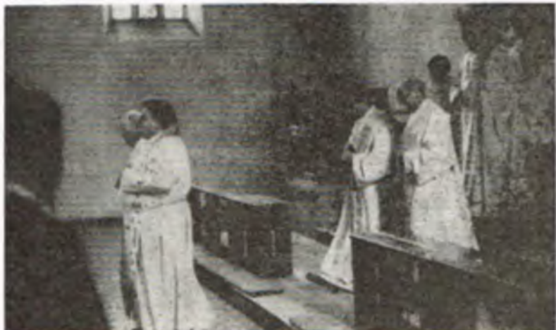
Zurich. Fragment procesji