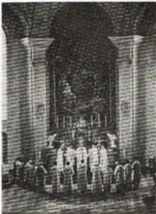
Bp Leon Gauthier w otoczeniu nowo wyświęconych kapłanów