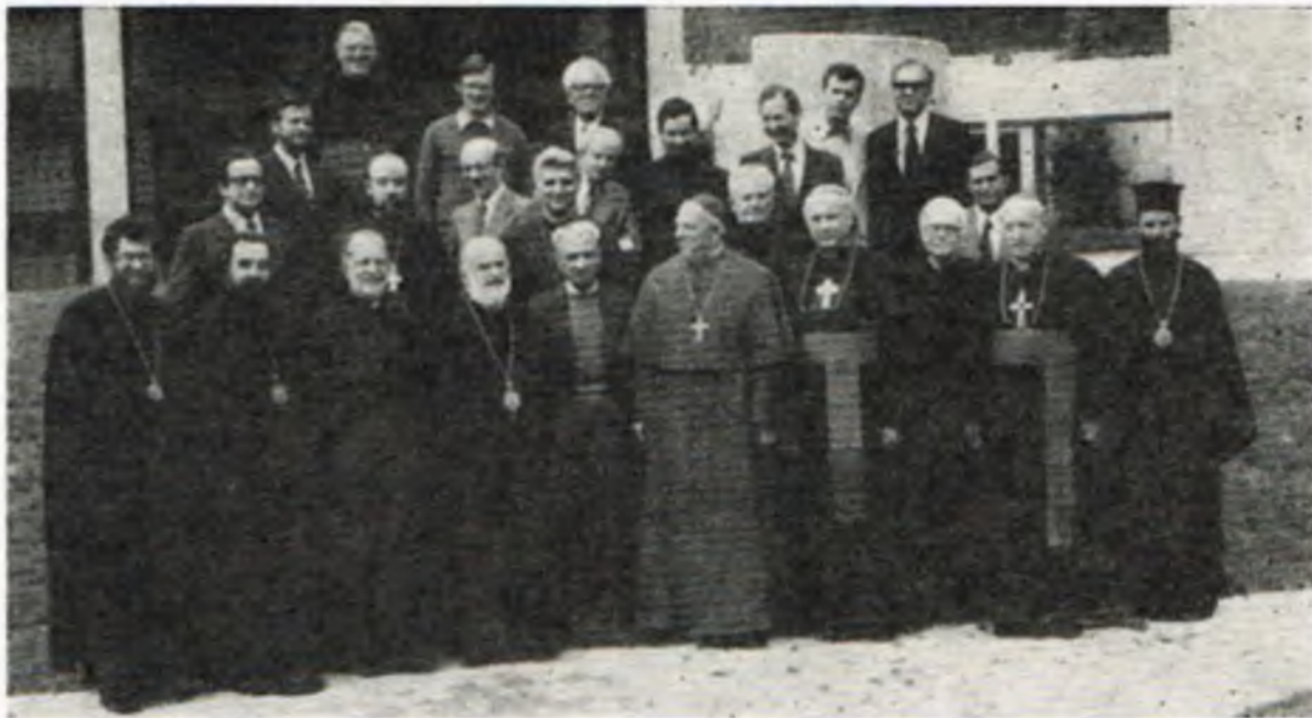
Uczestnicy Międzynarodowej Komisji do Spraw Dialogu Starokatolicko-Prawosławnego (Chambessy, 1977)

(Tłum. z ang., z broszu­ry pt. „ Eucharistic Wor­ship ”, wyd. przez Kościół Starokatolicki Niderlandów, E.B.)