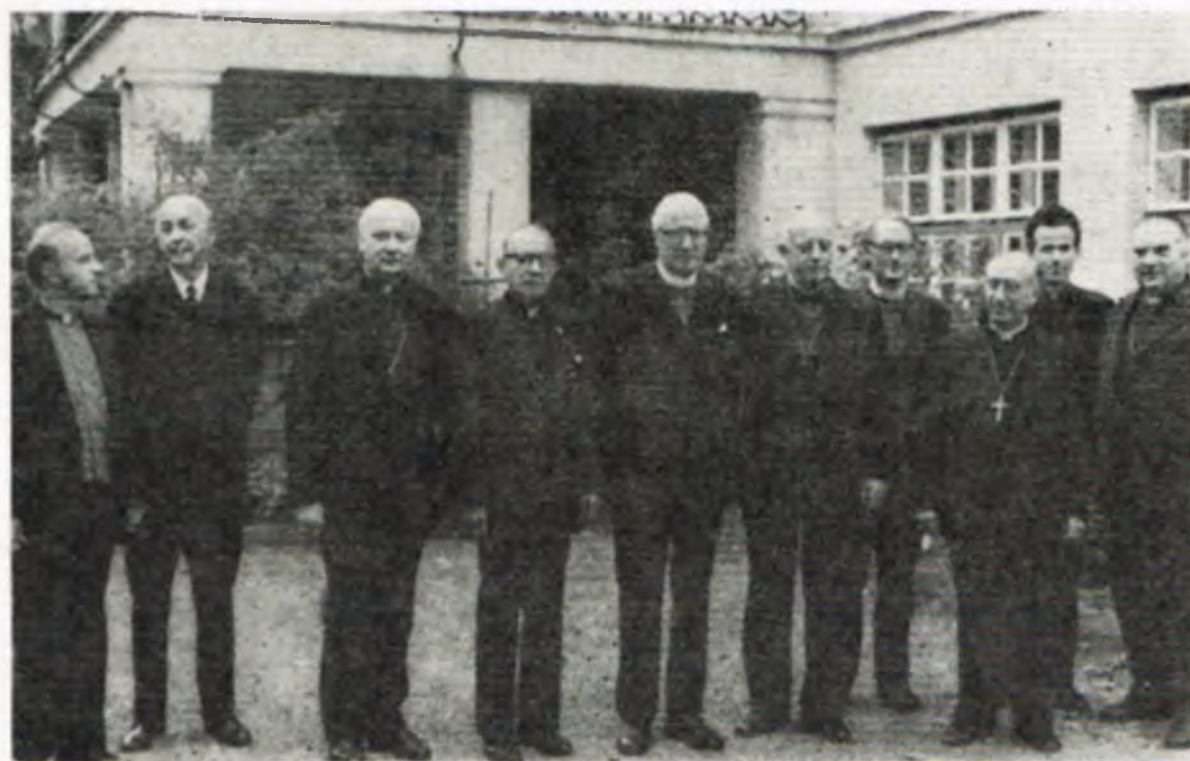
Uczestnicy sesji Międzynarodowej Konferencji Biskupów Starokatolickich Unii Utrechckiej