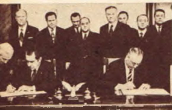
Podpisanie wspólnego komunikatu polsko-amerykańskiego. Dokument podpisują: w imieniu Polskiej Rzeczypospolitej Ludowej — Edward Gierek, a w imieniu Stanów Zjednoczonych AP — Richard Nixon.