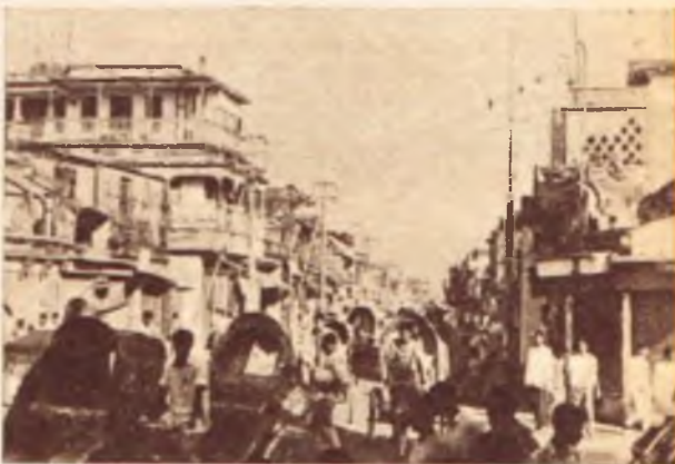
Życie w Republice Bangla Desz stopniowo powróciło do normy. Na ulicach Dhakki panuje ożywiony ruch.