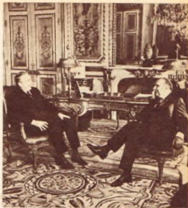
1 Sekretarz KC PZPR Edward Gierek i prezydent George Pompidou podczas rozmowy w Pałacu Elizejskim w Paryżu.

W Irlandii Północnej nadal trwają incydenty zbrojne. Irlandzka Armia Republikańska dokonała po raz 15 ataku rakietowego na pojazdy pancerne armii brytyjskiej.