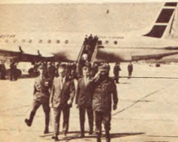
W dniach od 6 do 13 czerwca br. przebywała w Polsce delegacja partyjno-rządowa Republiki Kuby pod przewodnictwem premiera rządu rewolucyjnego Republiki — Fidela Castro Ru

W KRAJU rok 1972 przejdzie do historii jako rok intensywnego przyspieszenia tempa produkcji przemysłowej, zwłaszcza produkcji na rynek wewnętrzny i eksport wyrażającej się w dodatkowej produkcji wartości 20 miliardów złotych, wzmoczonej realizacji uchwał VI Zjazdu PZPR i pracy Partii i Rządu nad precyzowaniem dalekosiężnych programów w węzłowych sprawach gospodarki narodowej i polityki społecznej, a także aktywnej działalności na arenie międzynarodowej. Miniony rok był dalszym wydatnym krokiem w dziedzinie poprawy warunków pracy i życia ludności.