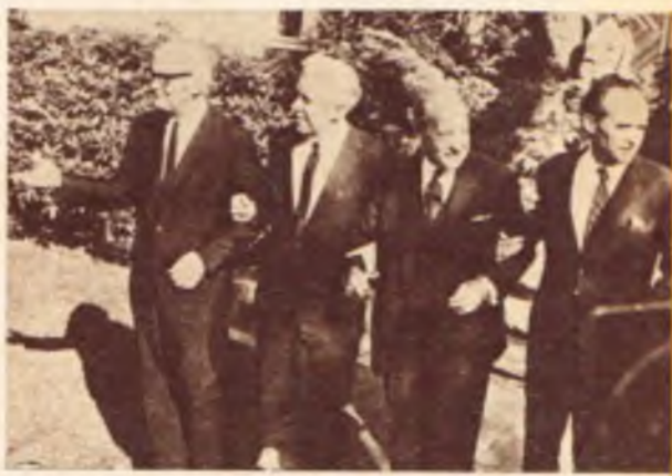
120-tym krokiem w kierunku urwania pokoju w Europie było porozumienie przedstawicieli czterech wielkich mocarstw w sprawie Berlina Zachodniego.