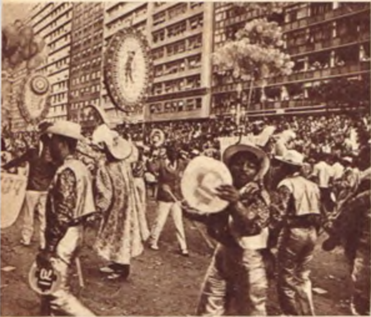
Wielka ulica Getulia Vargase w Rio zamieniona w kolorową salę balową.