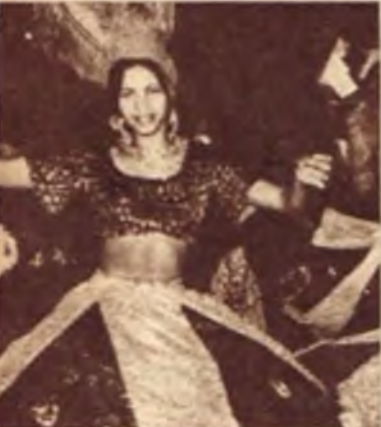
Ważny moment w favelach — muzyka zaprasza do samby