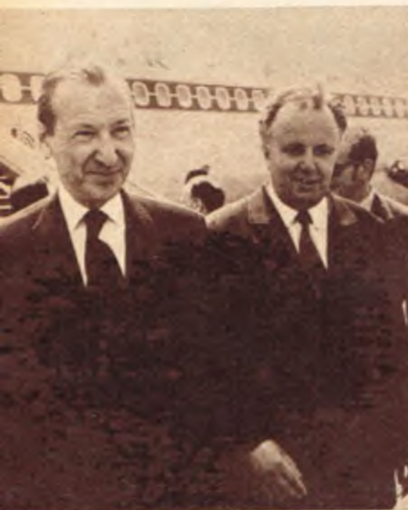
Na zaproszenie rządu PRL przybył do Polski sekretarz generalny Organizacji Narodów Zjednoczonych dr Kurt Waldheim.