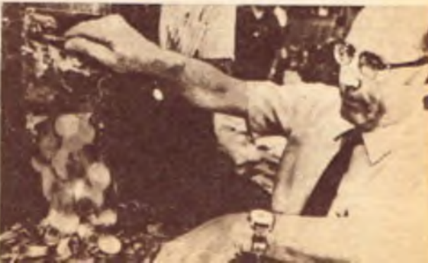
Kryza dolarowy. Pierwsza partia nowych dolarów amerykańskich, ze stopu nikiel, nie zawierająca domieszki srebra, wybita została w mennicy w Denver.