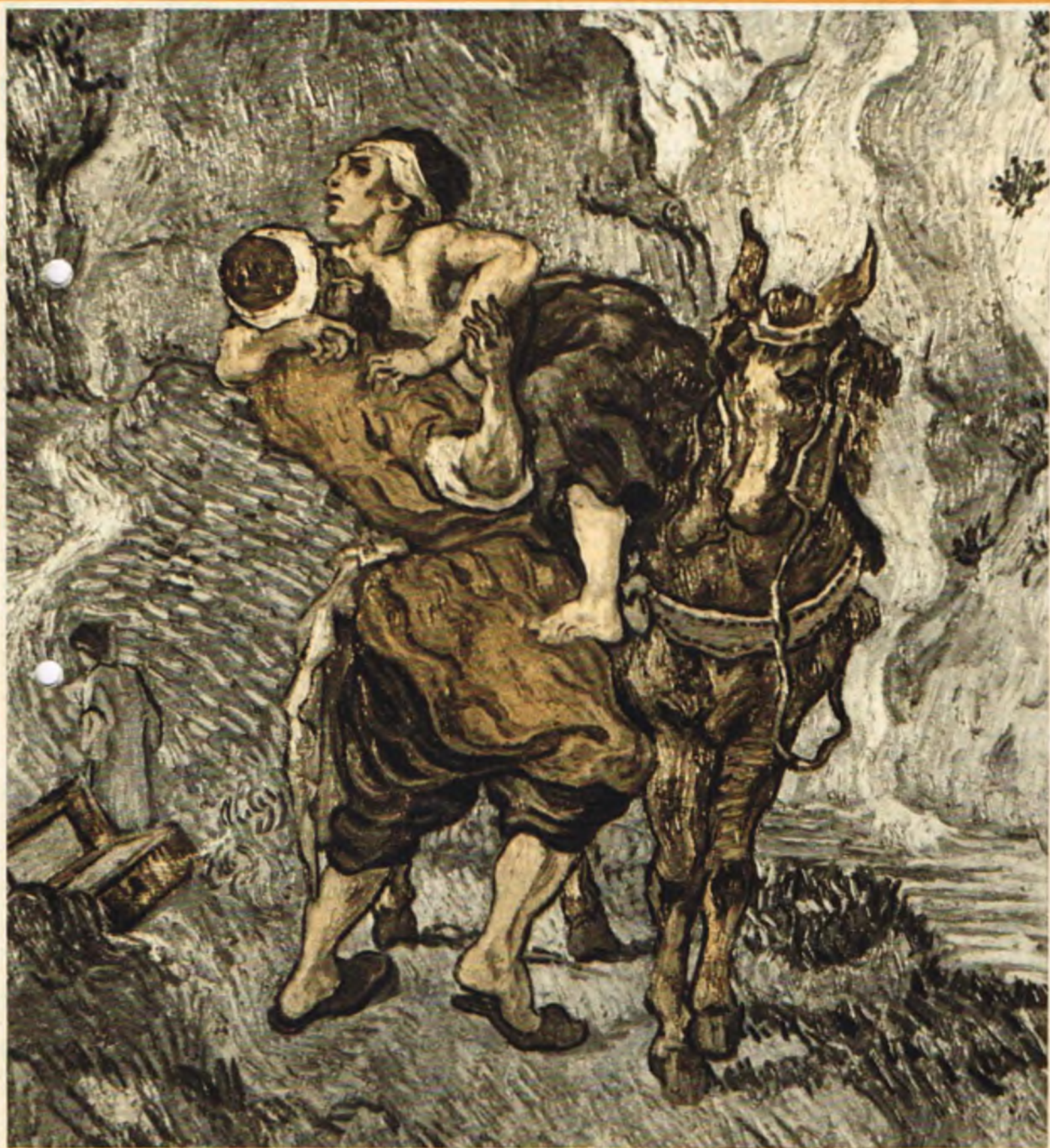
Milosierny samarytanin – mal. Vincent van Gogh (1853–1890)