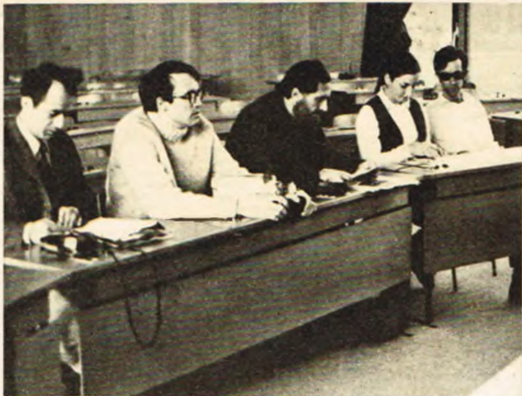
Studenci semestru 1969/1970 podczas seminarium w Instytucie Ekumenicznym. Pierwszy od lewej Autor artykułu

Młody teolog koreański ze smutkiem wyznawał studentowi niemieckiemu, że ma inne wyobrażenie o Bogu niż jego koledzy z Europy. Poza tym twierdził, że przedstawiciele teologii pietystycznej, przyniesionej do jego kraju przez towarzystwa misyjne, nie potrafią podjąć dialogu z buddyzmem.