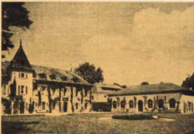
Główny budynek Instytutu Ekumenicznego w Bossey

Poznanie wielu problemów ruchu ekumenicznego zaniepokoiło młodych ekumenistów, szczególnie tych, którzy wywodzili się z Kościołów Azji czy Afryki. Kościoły te coraz częściej borykają się ze swymi problemami, którym ani pietystyczne towarzystwa misyjne, ani europejskie teologie nie są w stanie przyjąć z pomocą. W ostatnich latach, równoległe z budzeniem się świadomości politycznej państw na tych kontynentach, zaczyna się rozwijać świadomość kościelna, poszukująca takiej teologii, która byłaby zdolna do podjęcia dyskusji również z innymi religiami. Położenie geograficzne zmusza bowiem często młode Kościoły do podjęcia rozmów ze światem niechrześcijańskim.