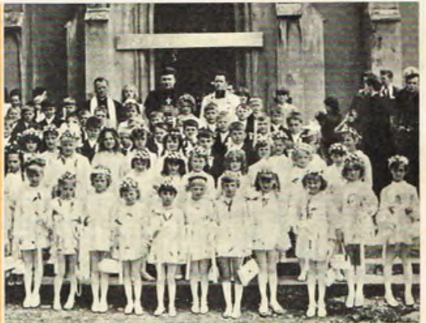
Pierwsza Komunia św. w Bolesławiu k. Olkusza