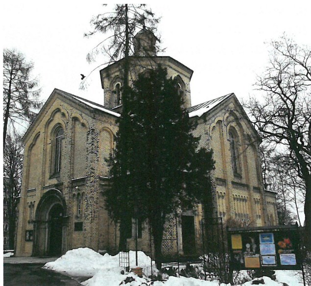
Katedra św. Ducha w Warszawie zimą