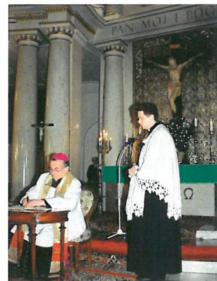
POLSKA RADA EKKUMENICZNA

Podpisanie dokumentu „Sakrament chrztu znakiem jedności. Deklaracja Kościołów w Polsce na progu Trzeciego Tysiąclecia” przez Zwierzchnika Kościoła Polskokatolickiego Bpa Viktora Wysoczańskiego w kościele ewangelicko-augsburskim Św. Trójcy w Warszawie, 23 stycznia 2000 rok