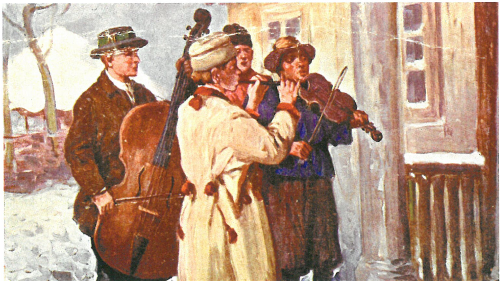
Żebyście byli zdrowi, weseli jako w niebie anieli, cały rok! (fragm. oracji z Podegrodzia k. Nowego Sącza)

Nowy Rok, przedtem bogaty w zwyczaje i obrzędy, obecnie, po sylwestrowej zabawie, stał się dniem odpoczynku, spędzanym w domowym zaciszu w gronie rodzinnym. Niezależnie od tego, jak współcześnie zmieniły się tradycje świętowania Nowego Roku, dobrze, wzorem naszych przodków przeżyć ten czas wzniosłe i radośnie, dzieląc się przy tym swoim szczęściem z bliskimi.