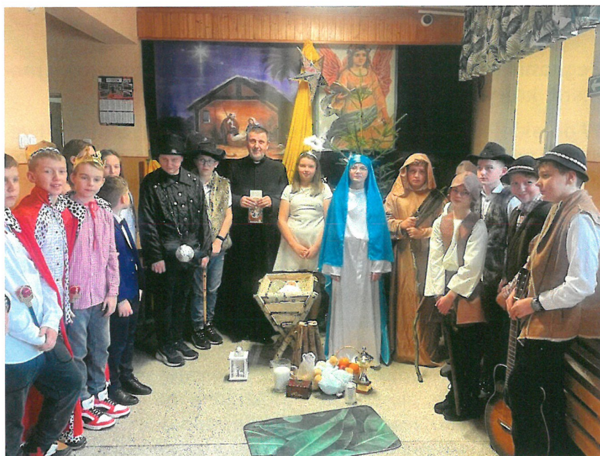
W naszych parafiach Jasełka cieszą się dużym zainteresowaniem, m.in. w Szkole Podstawowej w Biskupicach Zabarycznych, 22.12.2023 r.

Forma inscenizacji bywa zwykle prosta, tu nie trzeba nic upięk-