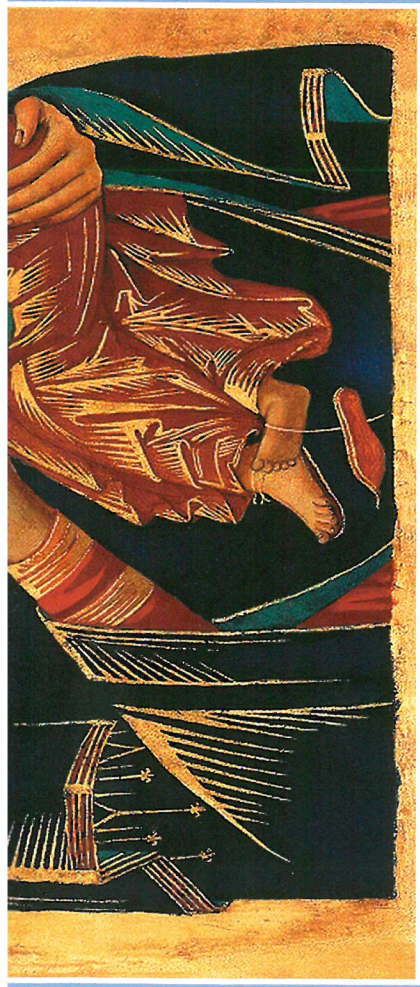
Najświętsza Maryja Panna Nieustającej Pomocy