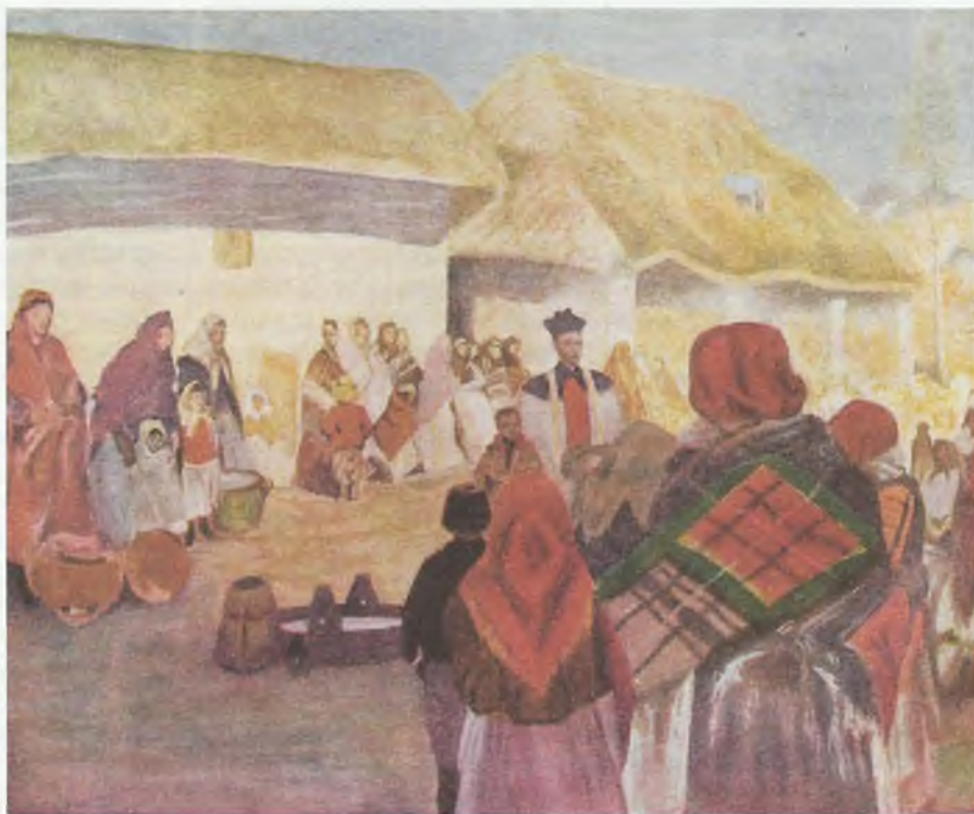
Święcone Kazimierza Tetmajera

Już w wielkośrodkowe „judaszki” wyczuwało się radosną atmosferę zbliżających się świąt. Nasi przodkowie już w zwykły dzień, gdy tajały ostatnie przymy śniegu, rozprawiali się z kukłą będącą symbolem zarówno zimy, jak