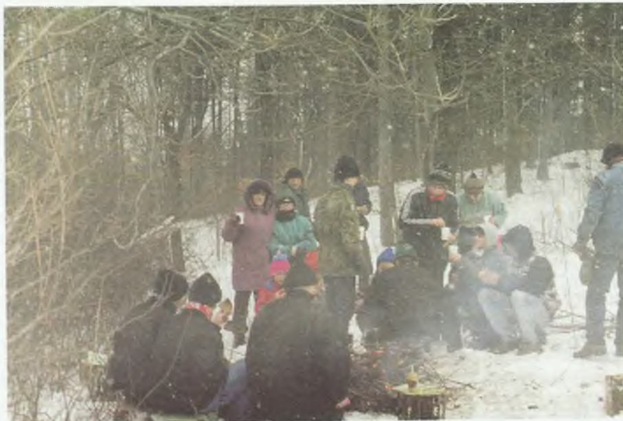
Ognisko w czasie kuligu