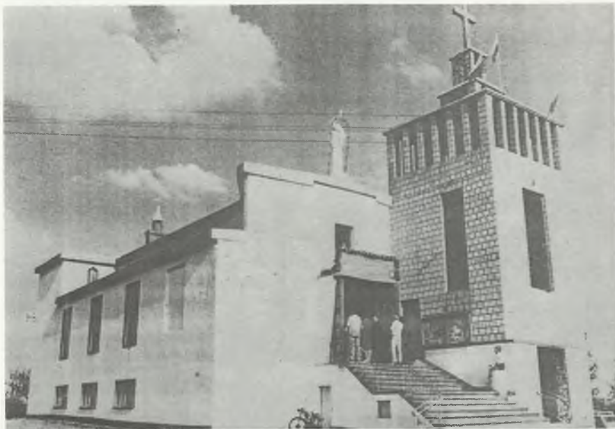
Świątynia Kościoła Polskokatolickiego w Strzyżowicach