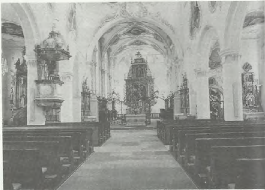
Na zdjęciu: kościół starokatolicki pw. św. Marcina w Rheinfelden

Dopiero później — w wyniku dalszego rozprzestrzeniania się chrześcijaństwa łączono gminy z główną, macierzystą gminą. Z czasem szczególną rolę zaczęli odgrywać biskupi stolic prowincji i krajów, powołując metropolitę lub arcybiskupstwa. Jednak nie pełnili oni żadnej władzy administracyjnej nad innymi biskupami. Nieco później zaczęto przysługiwać im prawo zatwierdzania wyboru nowego biskupa oraz prawo zwoływania synodów prowincjonalnych i krajowych. „Ich służba była i pozostała służbą