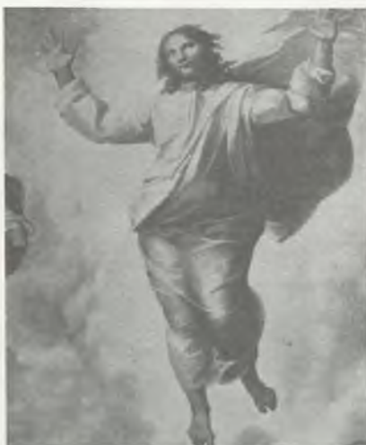
Chrystus uwielbiony (fragment), nam. przez Rafaela (1483-1520)

Najdobitniej jednak przypomniat Syn Boży tę prawdę w czasie mowy pożegnalnej, wygłoszonej do uczniów podczas Ostatniej Wieczerzy. Wyraźnie powiedział wówczas: „Teraz odchodzę do Tego, który mnie posłał” (J 14, 2). Dostrzegł jednak Pan Jezus, że na tę wiadomość posmutnieli, więc — by wlać otuchę i pociechę w ich serca, rzekł: „Jeszcze tylko krótki czas, a nie ujrzycie mnie, i znowu krótki czas, a ujrzycie mnie, bo idę do Ojca” (J 16, 16).