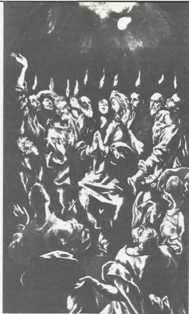
Zesłanie Ducha Świętego — mal. El Greco (1541-1614)

Być może zadajemy sobie pytanie, dlaczego Jezus, będąc Bogiem potrzebował kierownictwa Ducha Świętego? Co to znaczy? Nie zapominajmy, że Jezus był także w pełni człowiekiem. Posiadał ludzką naturę. Był obdarzony ludzką inteligencją, ludzkim sercem. Jego człowieczeństwo było naprawdę takie, jak nasze, i tak jak my, posiadał ludzką świadomość. Właśnie na płaszczyźnie człowieczeństwa Jezusa Duch Święty oświeca Go,