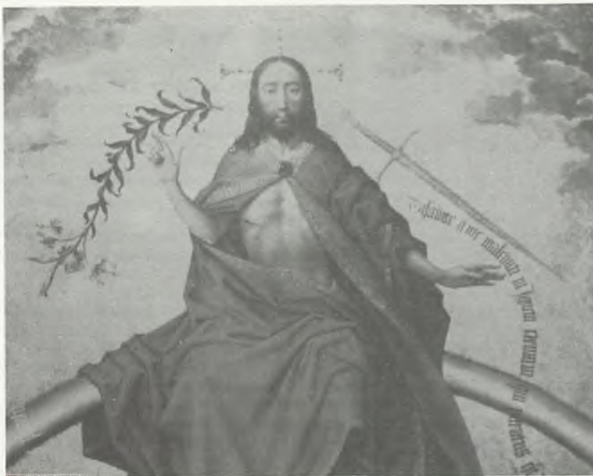
Chrystus w chwale (fragment), Van der Weyden (1400-1464)